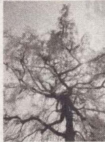
தலைவிருட்சம் வன்னி மரம்