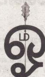
ஆதி மூலவர் (வஜ்ர வேல் ....1658 வரை)