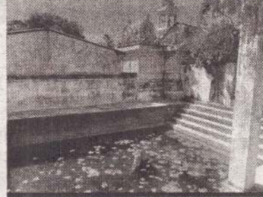
தீர்த்தம் - நறுநீர்க்கேணி (கற்பூரம் விளைந்த கேணி)

ஈழமணித்திருநாட்டின் ஆறுபடை வீடுகள் முருகன் ஆலயங்களில் ஒன்றானதும், "கற்பூரக்கந்தன்" என அழைக்கப்பட்ட கந்தவனக் கந்தனின் புண்ணிய வேதத்திரம் (இந்து ஒளி ஆவணி - புரட்டாதி. 2013 - இந்துமாமன்ற வெளியீடு) அருணகிரிநாத சுவாமிகள் இவ் ஆலயத்தின் மீது "உறவுசிறக்கிகள்" எனும் சிறப்புகளையும் அளித்து "கந்தசுவாமி கானகம்" எனும் தலைமுத்திரையையும் குறிப்பிட்டுள்ளார். "கந்தசுவாமி கானகம்" - கந்தவனம் இத்திருப்புகழ் இந்துசமய கலாச்சார அலுவல்கள் திணைக்களத்தினால் வெளியீடு செய்யப்பட்டுள்ளது.