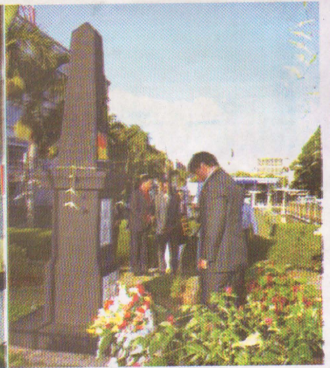
முள்ளிவாய்க்கால் நினைவுக்கல் மொரிசீயஸ்