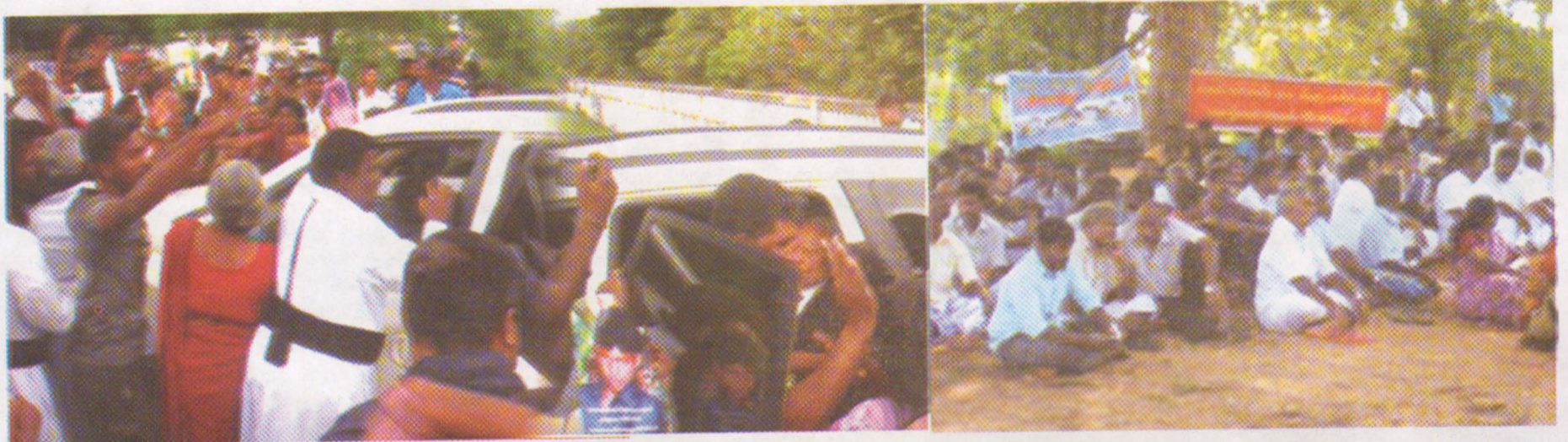
சம்பந்தனின் வாகனத்தை வழிமறித்த காணாமல் போனோரின் உறவுகள்