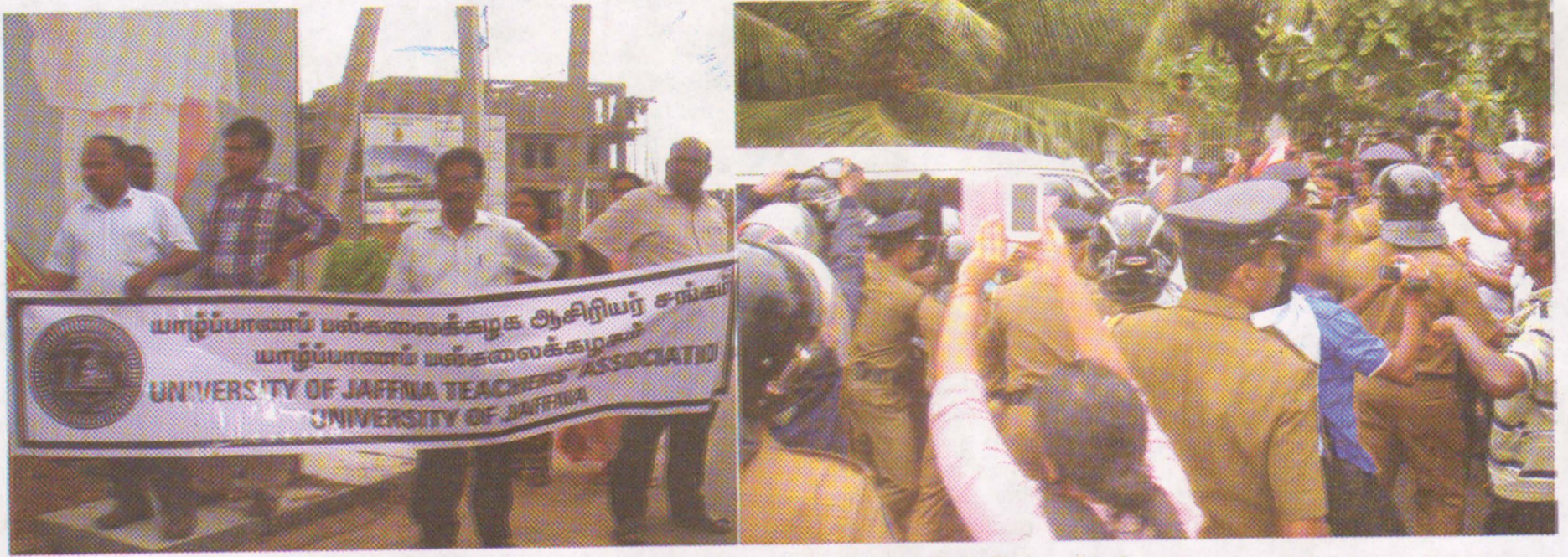
யாழ்ப்பில் காணாமல் போனவர்களது உறவுகளின் போராட்டம்