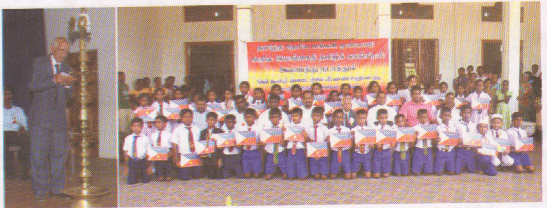
கிழக்கு மாகாணத்தில் மாவட்ட மட்டத்தில் புலமைப்பரிசில் பரீட்சையில் முதல் நிலை பெற்ற மாணவர்களின் கௌரவிப்பு நிகழ்வின் போது...