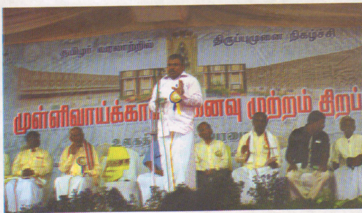
முள்ளிவாய்க்கால் நினைவு முற்றம் தஞ்சாவூர்