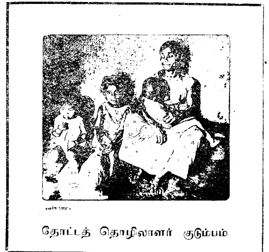
தோட்டத் தொழிலாளர் குடும்பம்

தோட்டத் தொழிலாளர்களில் 89% சதவீதம் 10' X 12' சதுர அடி பரப்பளவு கொண்ட லயன் காமராக்களிலேயே வாழ நிர்ப்பந்திக்கப்பட்டுள்ளனர் இச்சிறு லயன் காமராக்களிலேயே உணவு சமைக்கவும் நித்திரை செய்யவும் வேண்டியுள்ளது. இலங்கையில் மிக நெருக்கமாக வாழும் மக்களில் 75% சதவீதமானோர் தோட்டங்களிலேயே வாழ்கின்றனர். இவர்களின் லயன் காமராக்களில் கதிரை, மேசை, கட்டில் போன்ற எதுவித தளபாடங்களும் கிடையாது. லயன் களுக்கென மலசலகூட வசதிகளும் ஒழுங்கான தண்ணீர் வசதிகளும் இல்லை.