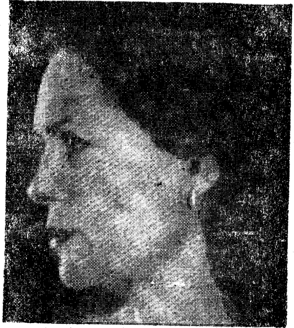
திருமதி. சோனியா காந்தி