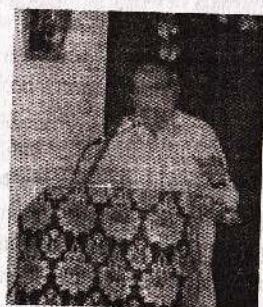
மல்கிகை நவம்பர் 2010 48