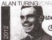
ALAN TURING YEAR 2012

சரி, துடுப்பு போடுவதை தொடர்ந்தும் செய்யக் கைகளில் வலு மட்டும் இருந்தால் போதும். இந்தத் தன்னம்பிக்கையைத் தொடர்ந்து செயற்படுத்துவது எப்படி?