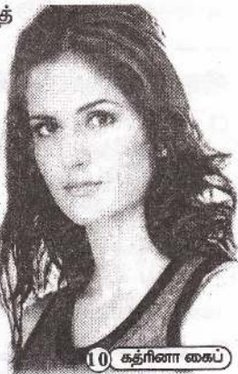
10 கதிரினா கைப்