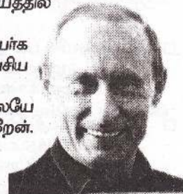
09 விளாடியின் புழன்