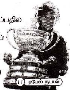
11 ரபேல் நாபல்

“வலை” வீசல் தொடரும்.. சி.என்.எச்.சாள்ஸ்.