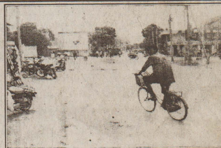
தடை செய்யப்பட்டதன் காரணமாக கஸ்தூரியார் வீதியின் (10 ஆம் பக்கம் பார்க்க)

(யாழ்ப்பாணம்) ஸ்ரான்லி வீதியில் 'எக்ஸ்போ எயர்' நிறுவனத்திற்கு முன்பாக வீத்தடை அமைக்கப்பட்டுள்ளது. இவ் வீத்தடையினால் ஸ்ரான்லி வீதியில் இருந்து வரும் வாகனங்களும் ஸ்ரான்லி வீதியை நோக்கிச் செல்லும் வாகனங்களும் பயணத்தை தொடரமுடியாத நிலை ஏற்பட்டுள்ளது. ஸ்ரான்லி வீதியூடாக யாழ். மினிபஸ், பஸ் தரிப்பு நிலையத்திற்குச் செல்லும் மாதகல், மூளாய், காரைநகர் மினிபஸ்கள் அவ் வீதி