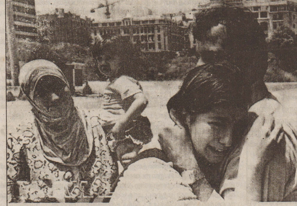
லெபனானில் இருந்து வெளியேறும் ஆஸ்திரேலியா நாட்டை சேர்ந்த ஒரு பெண், தன் தந்தையை கட்டி தழுவி அழுகிறாள்

அமெரிக்காவில் இருந்து ஆயுதங்களை ஏற்றிக்கொண்டு கப்பல் புறப்பட்ட விஷயம் பகிரங்கமாக அறிவிக்கப்படவில்லை. ரகசியமாக புறப்பட்ட இந்த கப்பலில் அமெரிக்க ஊழியர்கள் இருவரும் அனுப்பப்பட்டுள்ளனர். எவ்வளவு ஆயுதங்கள் அனுப்பப்பட்டு உள்ளன என்று அமெரிக்க இராணுவ அதிகாரிகளோ இராணுவத் தலைமையகமான பென்டகன் அலுவலகமோ தெரிவிக்கவில்லை. ஆனால் 1973 ஆம் ஆண்டில் நடந்த அரபு இஸ்ரேல் போரின் போது அனுப்பப்பட்டது போல இதை ஒப்பிக்கவாது என்று அதிகாரிகள் கூறியதாக நியூயோர்க் டைம்ஸ் குறிப்பிட்டுள்ளது. (அ)