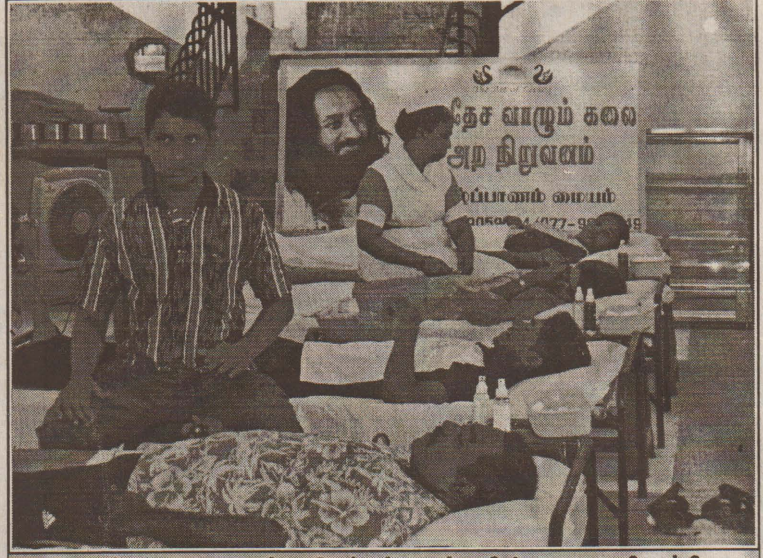
வாமும் கலை குருஜி ரவிசங்கர் அவர்களின் ஜனன தினத்தினை முன்னிட்டு கடந்த 7 ஆம் திகதி நல்லூரிலுள்ள மாங்கோல் உணவகக் கட்டடத்தில் யாழ்போதனா வைத்தியசாலை இரத்த வங்கிக்கு குருதிக் கொடை வழங்கும் நிகழ்வு இடம்பெற்றது. இந்நிகழ்வில் 33 வாமும் கலை உறுப்பினர்கள் குருதிக் கொடை வழங்கினர்.

(சுழிபுரம்) மூளாய் வதிரன்புவோ ஸ்ரீ சித்தி விநாயகர் தேவஸ்தான வருடாந்த மகோற்சவம் கடந்த 01.05.2006 திங்கட்கிழமை கொடியேற்ற வைபவத்துடன் ஆரம்பமாகியது. தொடர்ந்து திருவிழா 13 தினங்கள் நடைபெறும். எதிர்வரும் 11 திகதி தேர்த் திருவிழாவும் மறு நாள் வெள்ளிக்கிழமை தீர்த்தத் திருவிழாவும் நடைபெறும். தினமும் மாலை 7 மணி முதல் 8 மணிவரை தெய்வீக இசை அரங்கும் இடம்பெறுகின்றது. (ச-5)