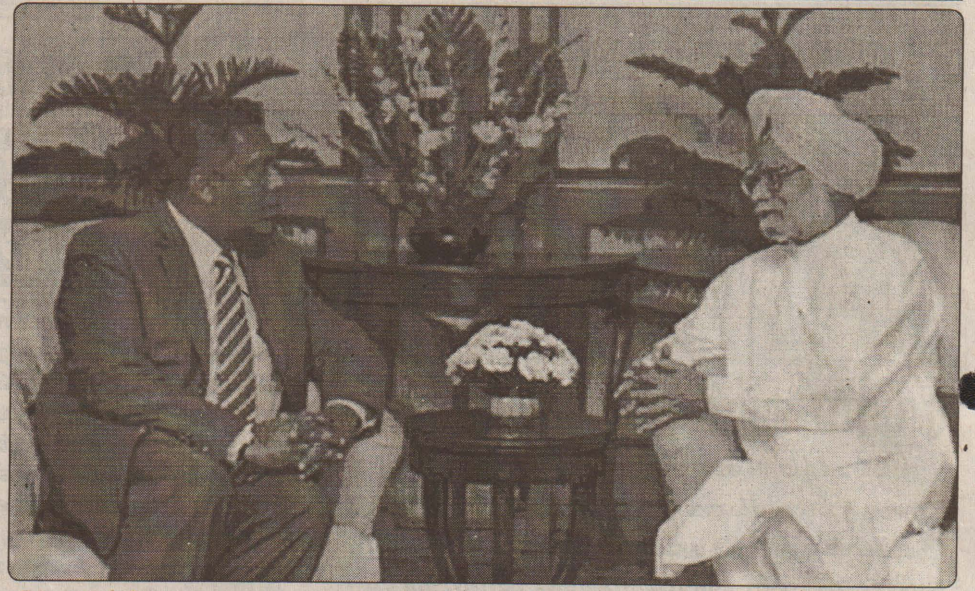
விற்கு இந்தியா ஆதரவு வழங்கவேண்டும் எனவும் வெளியுறவு அமைச்சர் கேட்டுள்ளார். இதேவேளை அனைத்துத் தரப்பினரும் ஏற்றுக் கொள்ளக்கூடிய சமூகமான அரசியல் தீர்வொன்றை காணவேண்டுமென இந்தியா

யகத்தில் நடத்தப்பட்ட தற்கொலைத் தாக்குதல் அதனைத் தொடர்ந்து ஏற்பட்ட பதற்றமான சூழ்நிலைகள் குறித்து மங்கள சரமவீர மன்மோகன் சிங்கிற்கு விபரித்துள்ளார். இதன்போது தமிழீழ விடுதலைப்புலிகளின் கட்டுப்பாட்டுப் பகுதிகள் மீது வான் படைத்தாக்குதல் நடத்தவேண்டிய கட்டாய நிலை ஏற்பட்டது ஏன் என்பது குறித்தும் வெளிவிவகார அமைச்சர் இந்தியப் பிரதமரிடம் விபரித்திருப்பதாக கூறப்படுகிறது. இலங்கை இனப்பிரச்சினை விவகாரத்தில் இந்தியா தொடர்ந்து அனைத்து வழிகளிலும் உதவவேண்டுமென இந்தியப் பிரதமரிடம் சரமவீர கோரியிருப்பதாகவும் தெரிவிக்கப்படுகிறது. அத்துடன் ஐக்கிய நாடுகள் செயலாளர் நாயகத்திற்கு போட்டியிடும் ஜயந்த தனபால