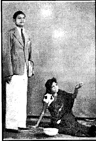
கீமாயணத்தில் ஒரு காட்சி பொன்னையா காளியம்மா

சிங்கள மொழிக்குரிய அந்தஸ்த்தைத் தமிழ் மொழிக்கும் தா”