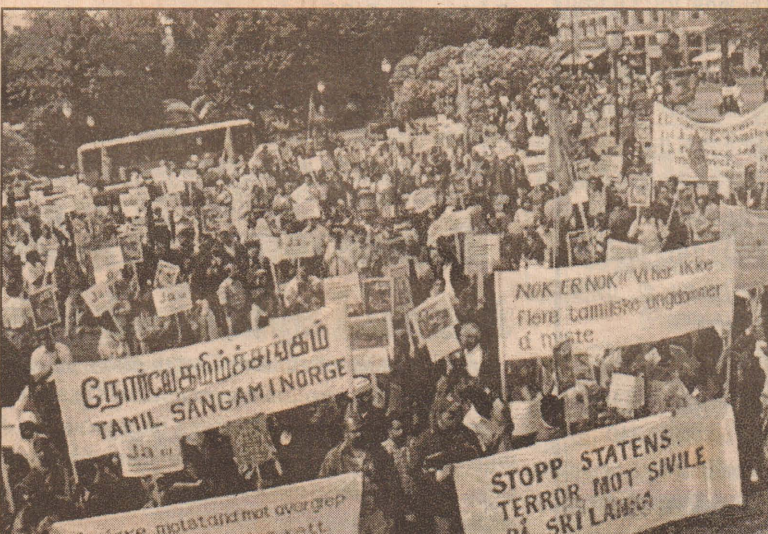
நோர்வே தலைநகர் ஒஸ்லோவில் வெளியுறவு அமைச்சு முன்றலில்...