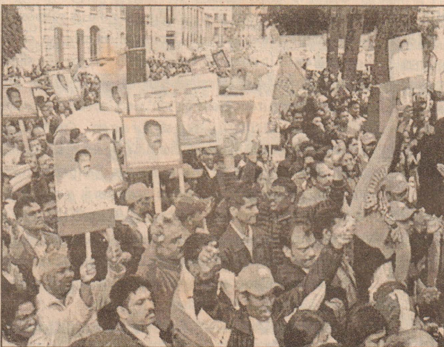
பாரிஸில் அமைந்துள்ள வெளிநாட்டு அலுவலகம் அமைச்சின் முன்பாக...