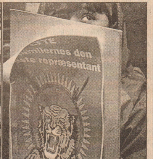
டென்மார்க் தலைநகர் கொப்பன் கேகனில்...