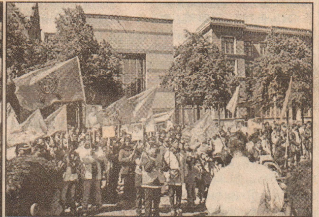
நெதர்லாந்தின் டென் கார்க்கில் அமைந்துள்ள பாராளுமன்ற முன்றலில்...