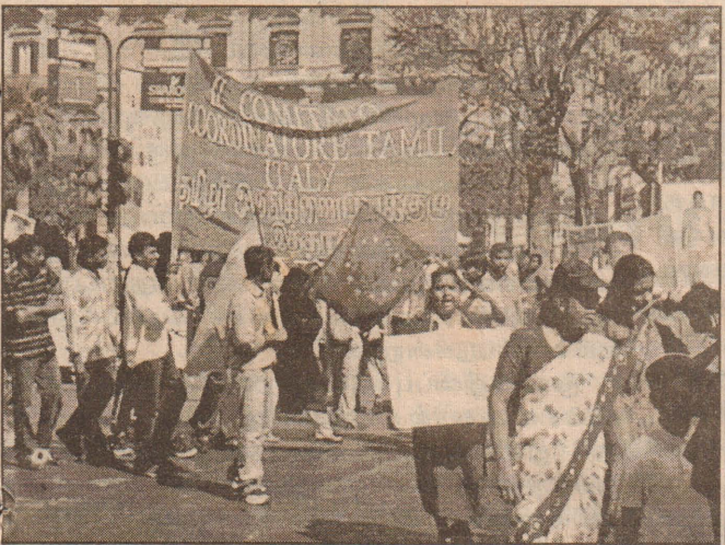
இத்தாலியில் வியா கவுரில் உள்ள உள்நாட்டு அமைச்சு முன்றலில்...