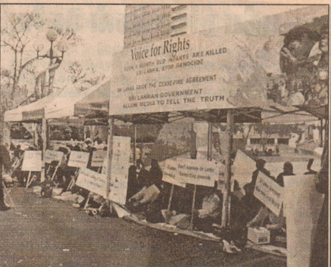
நியூஸிலாந்து நகர ஓட்டோ சதுக்கத்தில்..