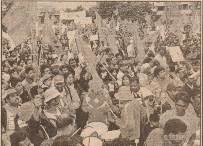
டூசில் டோவ் பாராளுமன்ற முன்றலில்...