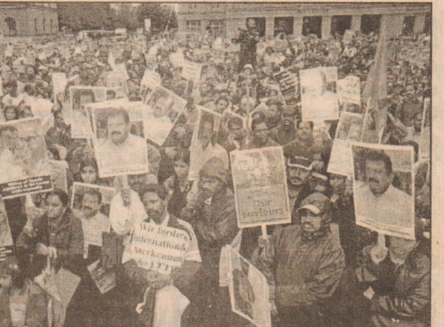
பேர்ண் நகரில் அமைந்துள்ள சுவிஸ் நாடாளுமன்ற முன்றலில்...