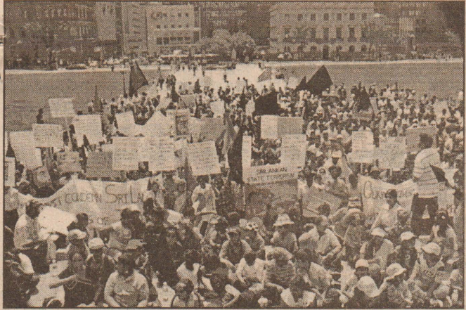
கனோடியத் தலைநகர் ஒட்டாவாவில் உள்ள நாடாளுமன்றக் கட்டடத்திற்கு முன்பாகவும் ரொறன்ரோ நகரிலும் நடைபெற்ற உரிமைக் குரல் நிகழ்வு...