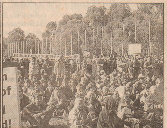
கன்பெராவுலுள்ள நடுவன் அரசின் நாடாளுமன்றக் கட்டடத்திற்கு முன்பாக...