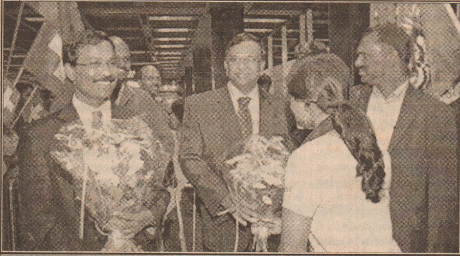
நோர்வேயிலிருந்து சுவில் சென்ற விடுதலைப்புலிகளின் தூதுக் குழுவினருக்கு சுவில் தமிழ் இளைமோர் அமைப்பினால் மலர்ச் செண்டு வழங்கி வரவேற்பு அளிக்கப்படுவதைப் படத்தில் காணலாம்.