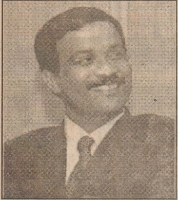
பாளர் சு.ப.தமிழ்ச்செல்வன் நம்பிக்கை தெரிவித்துள்ளார்.

(கிளிநொச்சி) எமது தமிழக உறவுகளின் உணர்வும் ஈடுபாடும் தமிழக மற்றும் இந்திய அரசுகளின் நிலைப்பாடுகளில் மாற்றத்தை உருவாக்கும் என்று தமிழீழ விடுதலைப் புலிகளின் அரசியல்துறைப்பொறுப்பு