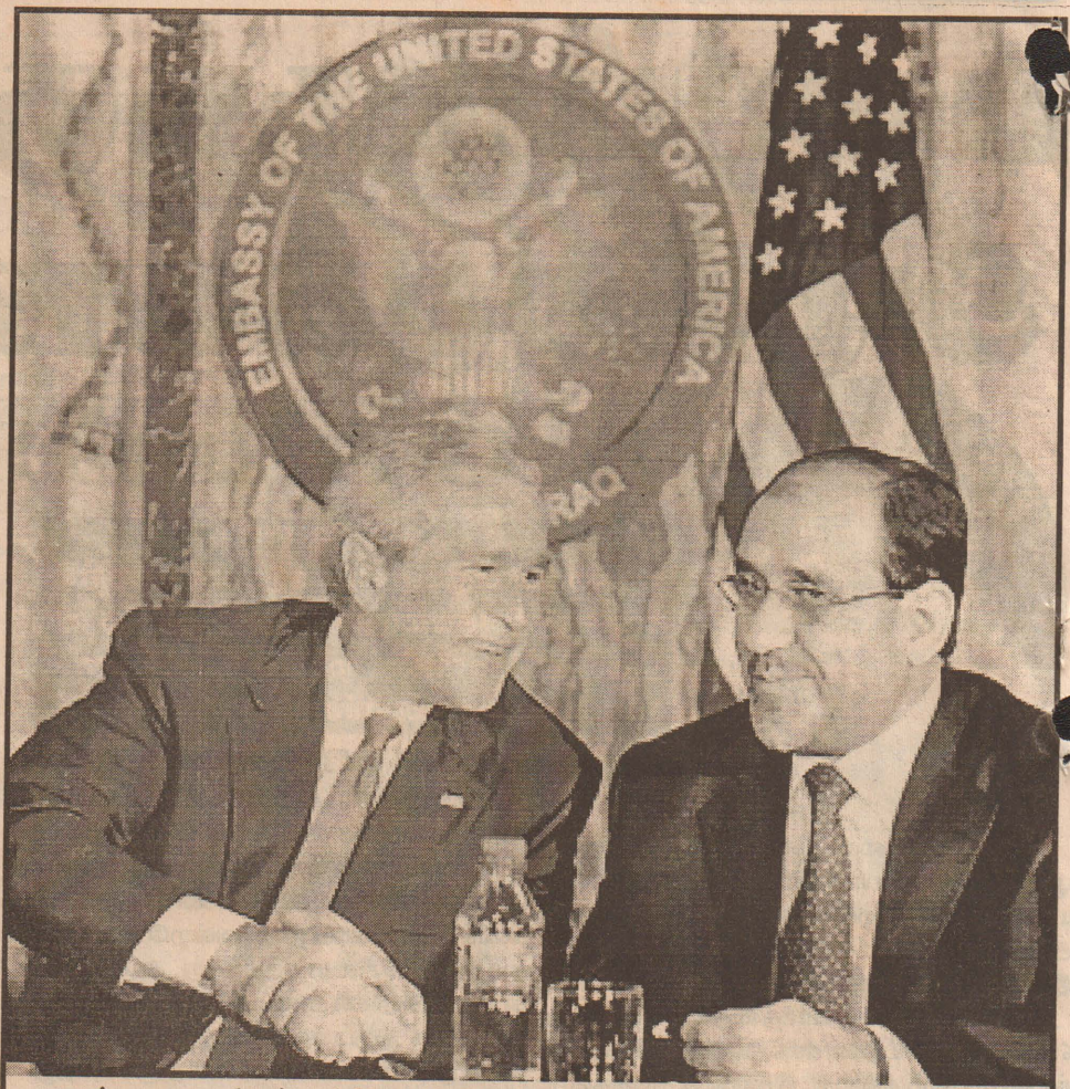
ஈராக் தலைநகர் பக்தாத்திற்கு திடீர் பயணம் மேற்கொண்ட அமெரிக்க அதிபர் புஷ் அங்குள்ள அமெரிக்கத் தூதரகத்தில் நடைபெற்ற ஈராக் அமைச்சரவைக் கூட்டத்தில் பங்கேற்றார். உடன் பிரதமர் நூரி அல்-மாலிகி.