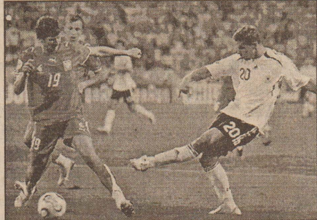
வசம் இருந்தபோதும் போலந்து தற்காப்பை தக்க முடியாமல் திணறி யது.

அணித்தலைவர் மைக்கேல் பாலக் அணிக்கு திரும்பியது போன்ற சாதக