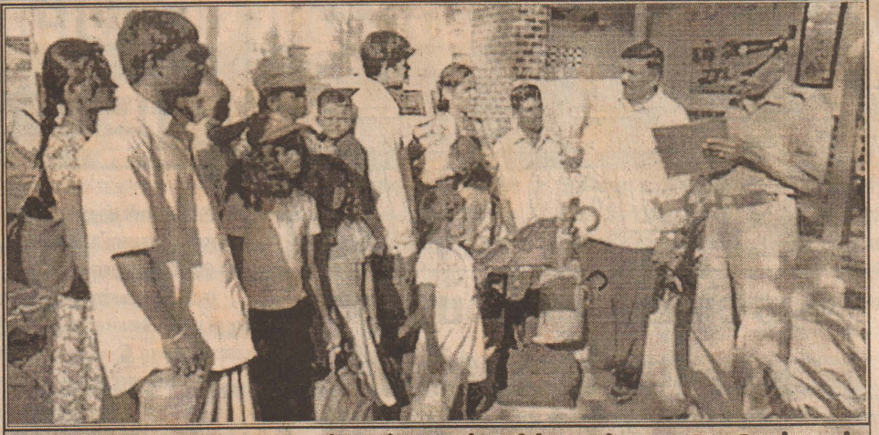
மன்னாரிலிருந்து தமிழகம் சென்ற ஈழத் தமிழ் அகதிகளை இராமேஸ்வரம் பொலிஸார் விசாரணைகளை மேற்கொள்வதைப் படத்தில் காணலாம்.

விஜயம் செய்ததோடு மீளக் குடியேறிய அல்லப்பட்டி மக்களின் குடியிருப்புக்களுக்கும் நேரில் சென்று அந்த மக்களின் நிலைமைகளை உட்கவியலாளர்களுக்கு விளக்கியுமுள்ளார். உட்கவியலாளர்களின் பாதுகாப்புக் காரணங்களுக்காக அன்றைய தினம் யாழ்ப்பாணத்தில் சில பகுதிகளில் பாதுகாப்பு அதிகரிக்கப்பட்டிருந்தது. அமைச்சர் டக்ளஸ் தேவானந்தா கொழும்பிலிருந்து வருவதற்காக இந்தப் பாதுகாப்பு ஏற்பாடுகள் செய்யப்பட்டிருந்ததாக நேற்றைய தினம் வலம்புரியில் பிரசுரமாகியிருந்த செய்தி தவறானது என ந.பி.டி.பி.யின் உட்கப்பிரிவு சுட்டிக்காட்டியுள்ளது. இதேவேளை அமைச்சர் டக்ளஸ் தேவானந்தா கடந்த இரண்டு வாரங்களுக்கு மேலாக யாழ்ப்பாணத்தில் தங்கியுள்ளமை குறிப்பிடத்தக்கது. (ச-5)