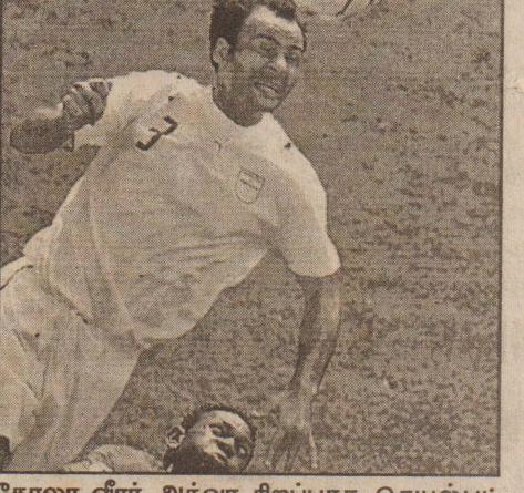
கோலா வீரர் அக்வா சிறப்பாக செயல்பட்டார். ஆட்டத்தின் 12 ஆவது நிமிடத்தில் 75 அடிதூரத்திலிருந்து கோல் லைனை நோக்கி அக்வா அடித்த அழகான உதை கோல் கம்பத்தில் பட்டு வெளியேறியது. தொடர்ந்து சிறப்பாக விளையாடிய அக்வாவின் கோல் அடிக்கும் முயற்சி முதல் பாதியில் பலமுறை வீணானது. 27 ஆவது நிமிடத்தில் ஈரானுக்கு கோனர் வாய்ப்பு கிடைத்தது.

ஆட்டநேர இறுதிவரை இதே நிலை நீடிக்க 1-1 என்ற கோல் கணக்கில் போட்டி சமநிலையானது. இப்போட்டியில் அங்கோலா வெற்றி பெற்றிருந்தால் 4 புள்ளிகளுடன் இரண்டாவது சுற்றில் நுழைய வாய்ப்பு அமைந்திருக்கும். அங்கோலாவின் தோல்வி 'டி' பிரிவில் இடம்பெற்ற மற்றொரு அணி யான மெக்சிகோவை இரண்டாவது சுற்றில் நுழைய வழிவகுத்துள்ளது.