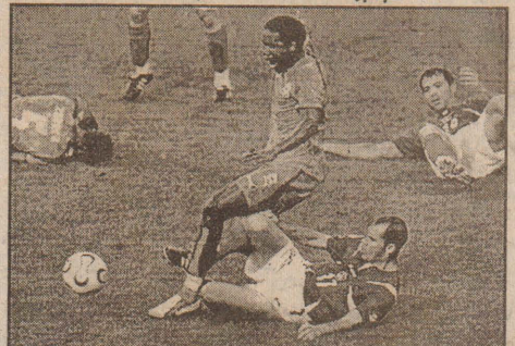
இலிக். பெட்ராக்கின் பிறி-கிக் வாய்ப்பை கோலாக மாற்றினார் இலிக். இதற்குப் பதிலடி கொடுக்க ஜவர்கோஸ்ட் சற்றுத் திணறியது.