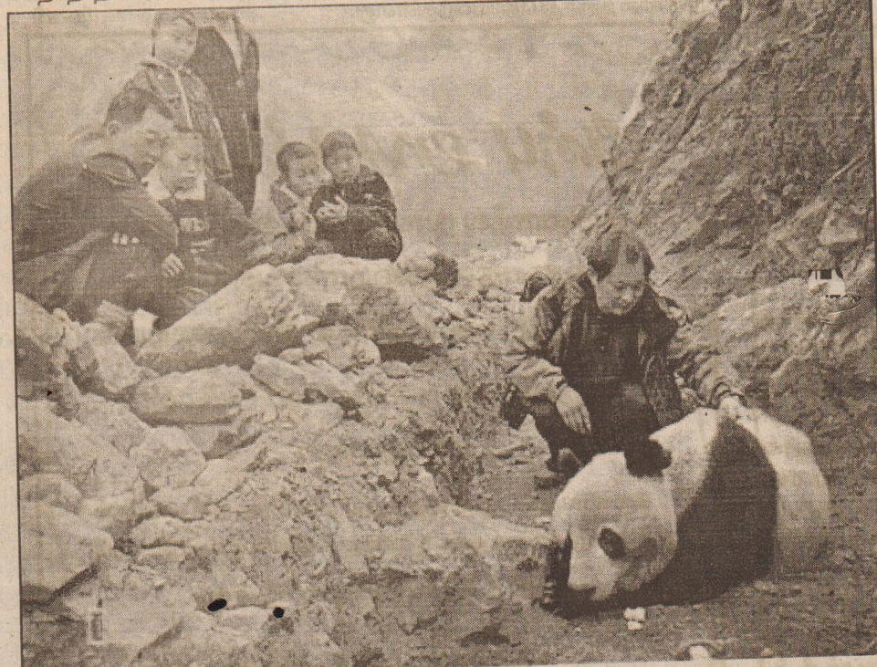
சீனாவில் சிசுவான் பகுதியில் உள்ள ஒரு நீர்த்தேக்கம் அருகே காயமடைந்து காணப்பட்ட பண்டா கரடியை வன விலங்கு அலுவலர் சோதிக்கிறார்