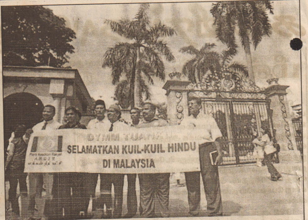
மலேஷியாவில் இந்து கோயில்கள் இடிக்கப்படுவதை தடுக்க கோரி கோலாலம்பூரில் உள்ள மன்னர் அரண்மனை முன்பு இந்து பக்தர்கள் அமைதியாக போராட்டம் நடத்தினர்