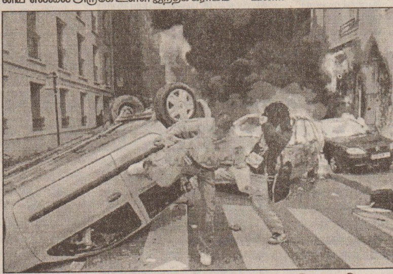
பாரிஸ் நகரில் நடந்த உள்வலத்தில் வன்முறை வெடித்து தெருக்களில் நிறுத்தி வைக்கப்பட்ட கார்களை அடித்து நொறுக்கி கலவரக் காரர்கள் தீவைத்து எரித்தனர்.

பழங்குடி இனத்தவர் வசிக்கும் பகுதி. எப்போதும் கலவரம் நடக்கும் இந்தப் பகுதியில், பாகிஸ்தான் இராணுவத்தினர் மீது நேற்று முன்தினம் அதிகாலையில் தீவிரவாதிகள் ரொக்கெட் தாக்குதல் நடத்தினர். உடன் இராணுவத்தினரும் பதிலடி கொடுத்தனர். இரண்டு மணிநேரம் நடைபெற்ற இந்த மோதலில், 20 தீவிரவாதிகளும், இராணுவ வீரர் ஒருவரும் பலியாயினர். (கு)