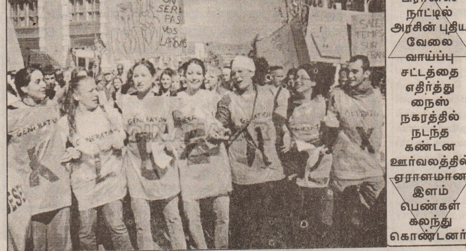
பிரான்ஸ் நாட்டில் அரசின் புதிய வேலை வாய்ப்பு சட்டத்தை எதிர்த்து நடைபெற்ற நகரத்தில் நடந்த கண்டன உள்வலத்தில் ஓராளமான இளம் பெண்கள் கலந்து கொண்டனர்.

ஹான் பெண்ணுரிமைக்காகவும், சுற்றுச்சூழல் கொள்கைக்காகவும் தனது வாழ்வில்