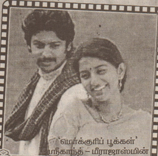
'மெர்க்குரிப் பூக்கள்' பரீகாந்த் - மீராஜாஸ்மின்