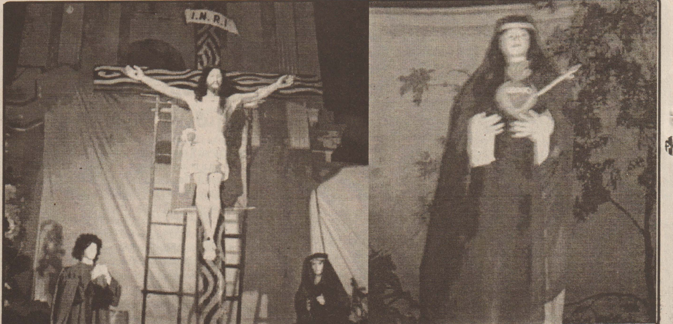
குருநகர் யாகப்பர் ஆலயத்தில் திருப்பாடுகளின் நினைவுகளை முன்னிட்டு நேற்றுமுன்தினம் பெரிய வெள்ளி அன்று காண்பிக்கப்பட்ட இயேசுவின் மரித்த நிகழ்வுகள்.

இந்நிலையில் அரசாங்கம் இரு நாட்டு முஸ்லிம்களிடமும் மன்னிப்புக் கோர வேண்டும். நாடு கடத்தப்பட்ட அறிஞரை மீண்டும் இலங்கைக்கு வர ஆவண செய்ய வேண்டும் எனக் கோரிக்கை விடுத்துள்ளார். (க)