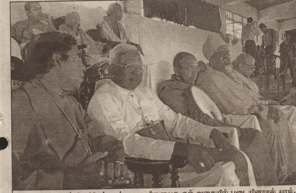
சுனாமியினால் உயிரிழந்தவர்களை நினைவுகூரும் வகையில் படையினரால் யாழ். குரையப்பா விளையாட்டரங்கில் நடத்தப்பட்ட சர்வமதப் பிரார்த்தனையின் ஒரு காட்சி.