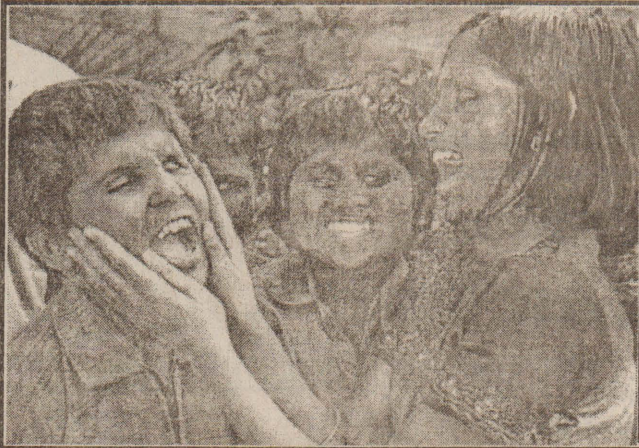
பெங்களூரில் உள்ள பார்வையற்ற சிறுவர்களுக்கான பள்ளியில் நடைபெற்ற ஹோல் கொண்டாட்டத்தில் சிறுவர் சிறுவிகள் வண்ணப் பொடிகளைத் தூவி மகிழும் காட்சி. அவர்களால் வண்ணத்தைக் காண இயலாவிட்டாலும் அவர்களது உள்ளத்தின் எண்ணத்தைக் காணமுடிகிறது.