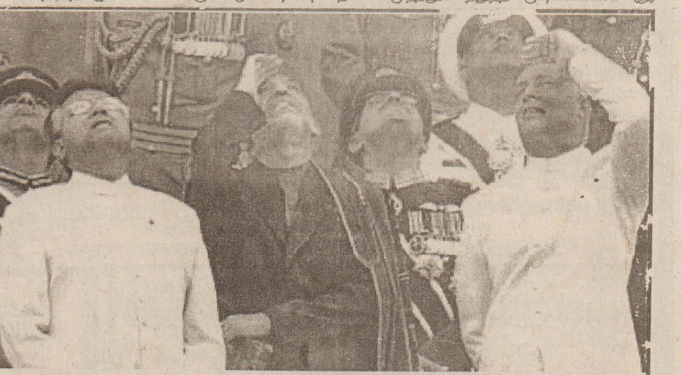
பாகிஸ்தானின் தேசிய தினப் பேரணி நேற்று முன்தினம் இஸ்லாமாபாத்தில் நடைபெற்றது. விழாவிற்கு ஆப்கானிஸ்தான் பிரதமர் ஹமீட் கர்சாய் சிறப்பு விருந்தினராக வந்திருந்தார். விழாவில் பாக். வீரர்கள் நடத்திய விமான சாகசத்தை பார்த்து மகிழும் பாகிஸ்தான் அதிபர் பர்வேஸ் முஷாரப், ஹமீட் கர்சாய் மற்றும் பாக். பிரதமர் செளகட் ஆசீஸ் ஆகியோர் பட்டியல் காணப்படுகின்றனர்

முஸ்லிம் புனித தலத்திற்கு சென்று விட்டு சுமார் 40 பேர் படகில் திரும்பிக் கொண்டிருந்தபோது இந்த விபத்து நேரிட்டுள்ளது. (கு)