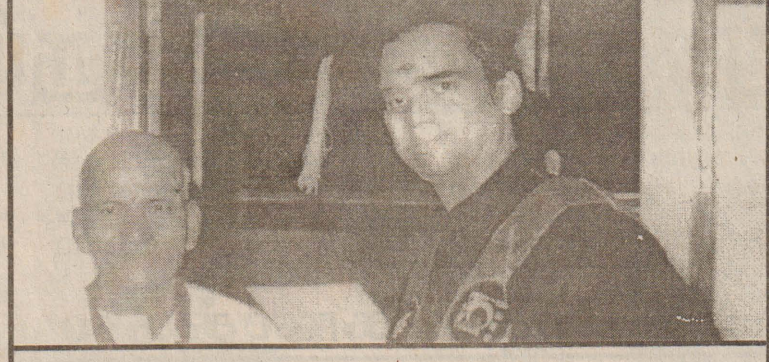
கலாநிதிப் பட்டம் வழங்கிய போது