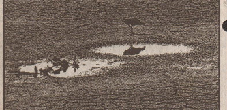
இந்தியாவில் தென் மாவட்டங்களில் வெயிலின் தாக்கம் தற்போதே அதிகமாகவுள்ளது. கிந்திலையில் தண்ணீர் பற்றாக்குறையும் பெரும் பிரச்சனையாகும் நிலை உள்ளது. அங்கு நீர்நிலை ஒன்று வறண்டு கிடக்கும் காட்சி.

ஈராக் நாட்டின் கர்பாலாநகரில் நேற்றுமுன்தினம் ஈராக் பொலிஸாரும், அமெரிக்க படையினரும் இணைந்து தீவிர தேடுதல் வேட்டை நடத்தினர். இதில் தீவிரவாதிகள் என சந்தேகிக்கப்படும் 131 பேர் பிடிபட்டனர். அந்தப் பகுதியில் இருந்து ஏராளமான ஏவுகணைகள், வெடிமருந்துகள் மற்றும் ஆயுதங்களும் பொலிஸாரால் கைப்பற்றப்பட்டன. பிடிபட்ட தீவிரவாதிகள் புனித நகரான கர்பாலா மீது மிகப் பெரிய தாக்குதல் நடத்தத் திட்டமிட்டு இருந்ததாகக் கூறப்படுகிறது. இதுகுறித்து ஈராக் பொலிஸார் தீவிர விசாரணை நடத்தி வருகின்றமை குறிப்பிடத்தக்கது. (7)