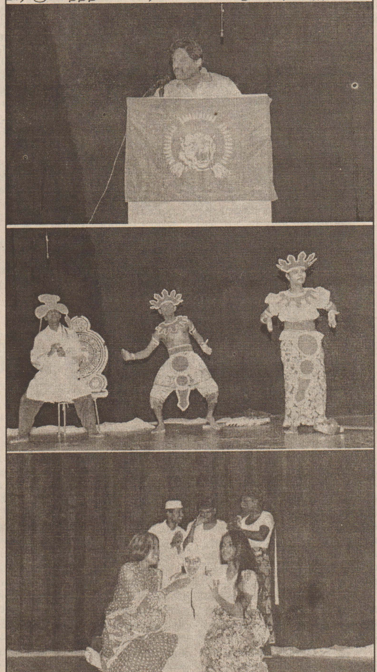
25.03.2005 சுவீடனில் நடைபெற்ற சுதந்திர தாகம் நிகழ்வின் சில காட்சிகள்.

செயற்படுவதற்கு விடுதலைப்புலிகள் விருப்பம் தெரிவித்துள்ளதாகவும் கதிர்காமர் அந்த ஊடகவியலாளர் மகாநாட்டில் மேலும் தெரிவித்துள்ளார். (க-7) “தூறல்” சஞ்சிகைக்கு ஆக்கங்கள் கோரல் தமிழ் மாணவர் ஒன்றியத்தினால் வெளியிடப்பட இருக்கும் “தூறல்” மாதாந்த சஞ்சிகைக்கான தரமான ஆக்கங்கள் பாடசாலை மாணவர்களிடமிருந்து கோரப்படுகின்றன. அறிவியல் தகவல்கள், தமிழ் பண்பாட்டு விழுமியங்களைப் பிரதிபலிக்கக் கூடிய சிறுகதைகள், கட்டுரைகள், கவிதைகள் மற்றும் விளையாட்டு தகவல்கள் ஏனைய அருமையான புதுமையான தகவல்கள் எதிர்பார்க்கப்படுகின்றன. ஆக்கங்களை வகுப்பு மாணவர் ஒன்றிய பிரதிநிதி ஊடாகவோ அல்லது தமிழ் மாணவா ஒன்றிய தலைமை செய்யல்கத்தின் ஊடாகவோ ஒப்படைக்குமாறு தமிழ் மாணவர் ஒன்றிய தூறல் வெளியீட்டுப் பிரிவு கேட்டுள்ளது. (க)