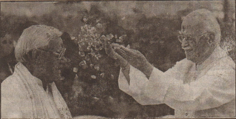
டில்லியில் முன்னாள் பிரதமர் வாஜ்பாய் இல்லத்தில் ஹோலிப்பண்டிகை கொண்டாடப்பட்டது. அப்போது முன்னாள் துணை பிரதமர் அத்வானி, வாஜ்பாய்க்கு மலர் தூவி மகிழ்ச்சியை வெளிப்படுத்திய காட்சி.

கத்துக்குத் தெரியப்படுத்தினார்கள். அந்தத் தகவலை இந்திய தூதரகம் இந்திய அரசுக்குத் தெரிவித்து அதன் காரணமாகவே மோடியின் பயணம் இரத்துச் செய்யப்பட்டதாகக் கூறப்படுகிறது. இங்கிலாந்தில் மோடி கைது செய்யப்பட்டால் இந்திய - இங்கிலாந்து உறவில் சிக்கல் ஏற்பட்டு விடும் என்ற அச்சத்தால் மோடியிடம் இந்தத் தகவலை மத்திய அரசு தெரிவித்து பயணத்தை இரத்துச் செய்ய வைத்ததாகத் தெரிய வருகிறது. வெளிநாட்டு அரசுத் தலைவரை இங்கிலாந்தில் கைது செய்த முன் உதாரணம் உண்டு. 1988ஆம் ஆண்டு சிலி சர்வாதிகாரி லண்டன் மருத்துவமனையில் சிகிச்சை பெற்றபோது லண்டன் நீதிமன்றம் ஒன்று அவரைக் கைதுசெய்ய உத்தரவு பிறப்பித்தது. கைது நடவடிக்கையும் மேற்கொள்ளப்பட்டமை குறிப்பிடத்தக்கது. (7)