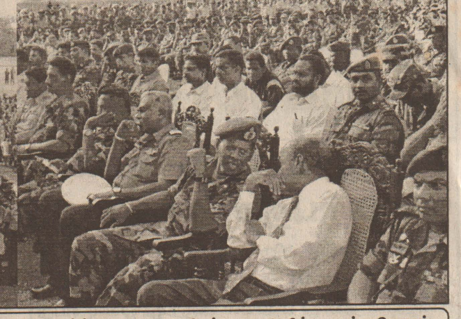
நேற்று முன்தினம் துறையப்பா விளையாட்டரங்கில் சுனாமி அனர்த்த முன்றாம்மாத நினைவை முன்னிட்டு சர்வமதப் பிரார்த்தனை நடைபெற்றது. அதில் கலந்துகொண்ட சர்வமதத்தலைவர்கள் மௌன அஞ்சல் செலுத்துவதையும் கலந்துகொண்டவர்களையும் படங்களில் காணலாம்.