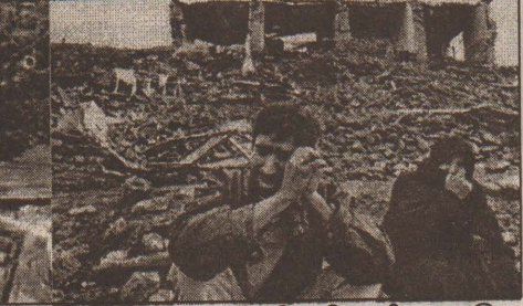
களான மேற்கு இந்தோனேஷியா, இலங்கை, இந்தியாவின் கரையோரப்பகுதிகள், மலேஷியா, தாய்லாந்து ஆகியவற்றைத் தாக்கக்கூடுமென அச்சம் தெரிவிக்கப்பட்டிருந்தது.