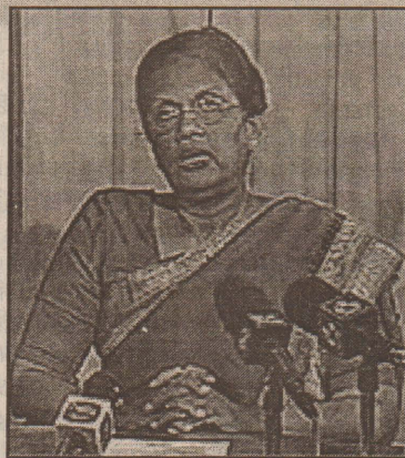
மும் ஜனாதிபதி தெரிவித்தார். சுனாமி அனர்த்தம் இடம் பெற்ற போதிலும் நாடு 55 சதவீதப் பொருளாதார வளர்ச்சியைக் கண்டுள்ளது என்றும் அவர் மேலும் தெரிவித்தார். (7-9)

யோரும் அவ்வைவத்தில் கலந்து கொண்டார்கள். பாதிக்கப்பட்ட மக்களுக்கு வீடுகளை நிர்மாணித்தல், புனர்வாழ்வு மற்றும் புனர்நிர்மாண நடவடிக்கைகள், கல்வி, சுகாதார துறைகளின் மேம்பாடு, நாட்டின் தற்போதைய பொருளாதார நிலை உட்பட பல விடயங்களைப் பற்றியும் அவர் கருத்துத் தெரிவித்தார். அத்துடன் இலங்கை மின்சார சபைக்கும், பெற்றோலியக் கூட்டுதலாபனத்திற்கும் தலா 80 கோடி ரூபா கடன் பழு ஏற்பட்டுள்ளது. ஆயினும் அதன் தாக்கம் பொது மக்களுக்கு ஏற்படாத வகையில் இந்த இரு நிறுவனங்களும் பாதுகாக்கப்படுவது அவசியமாகும். இலங்கை போக்குவரத்துச் சபையும், ரயில்வே திணைக்களமும் கூட நடத்திலேயே செயற்படுகின்றன. அவற்றையும் பாதுகாக்கவேண்டியது அவசியம் என