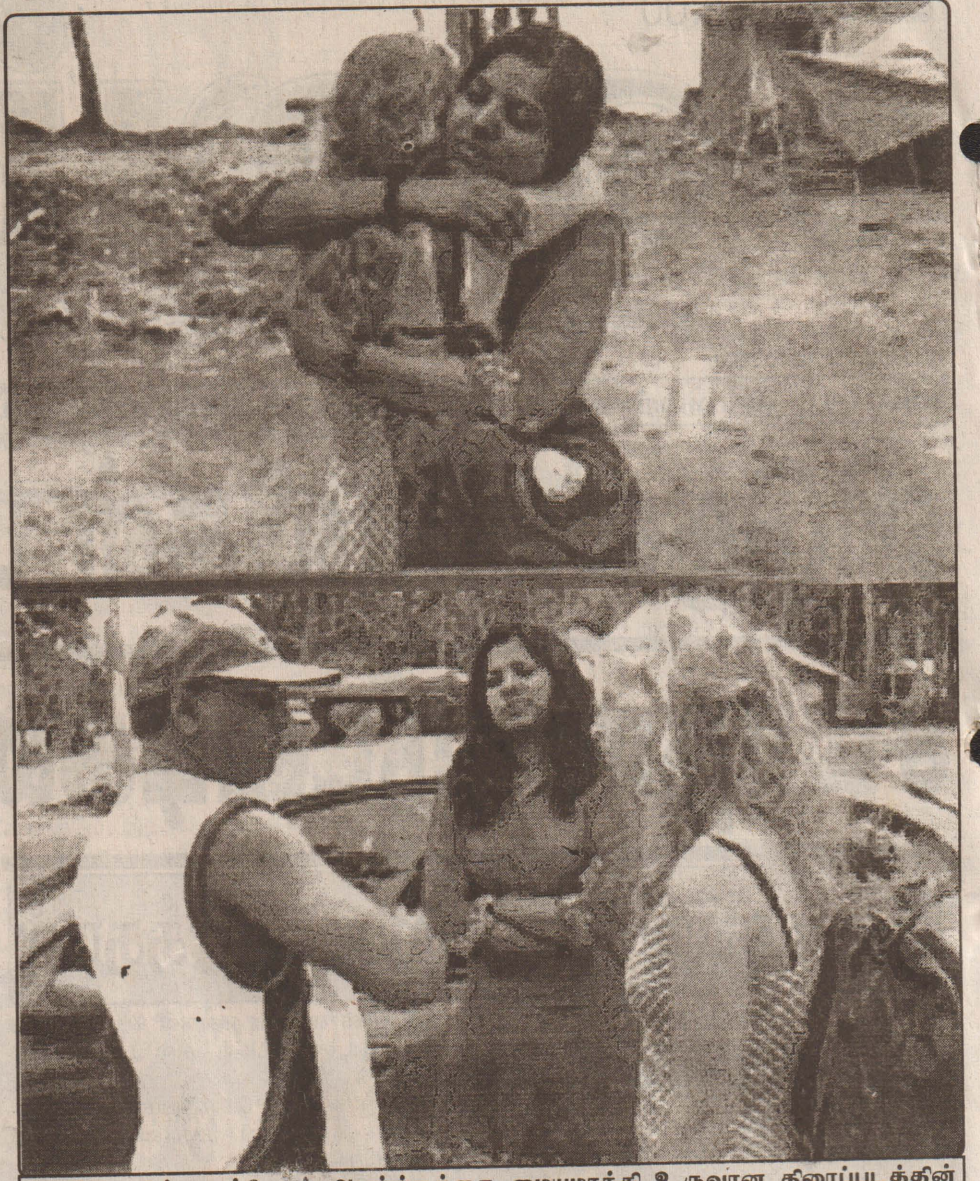
கிலங்கையின் கடற்கரை அினர்த்தத்தை மையமாக்கி உருவான திரைப்படத்தின் ஒளிப்பதிவுகள் முடிவற்ற நிலையில் படத்தொகுப்பு வேலைகள் தொடங்கியுள்ளது.

தீவகம் வடக்கு ஊர்காவந்துறைப்பிரதேசத்தில் கடும் வெப்பம் நிலுவதால் மக்கள் கடற்கரையோர மரங்களை நாடி வருகின்றனர். (க)