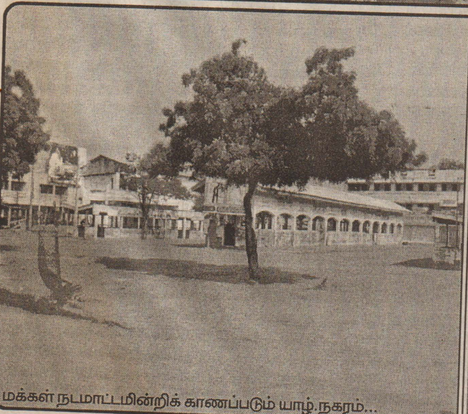
மக்கள் நடமாட்டமின்றிக் காணப்படும் யாழ்.நகரம்...