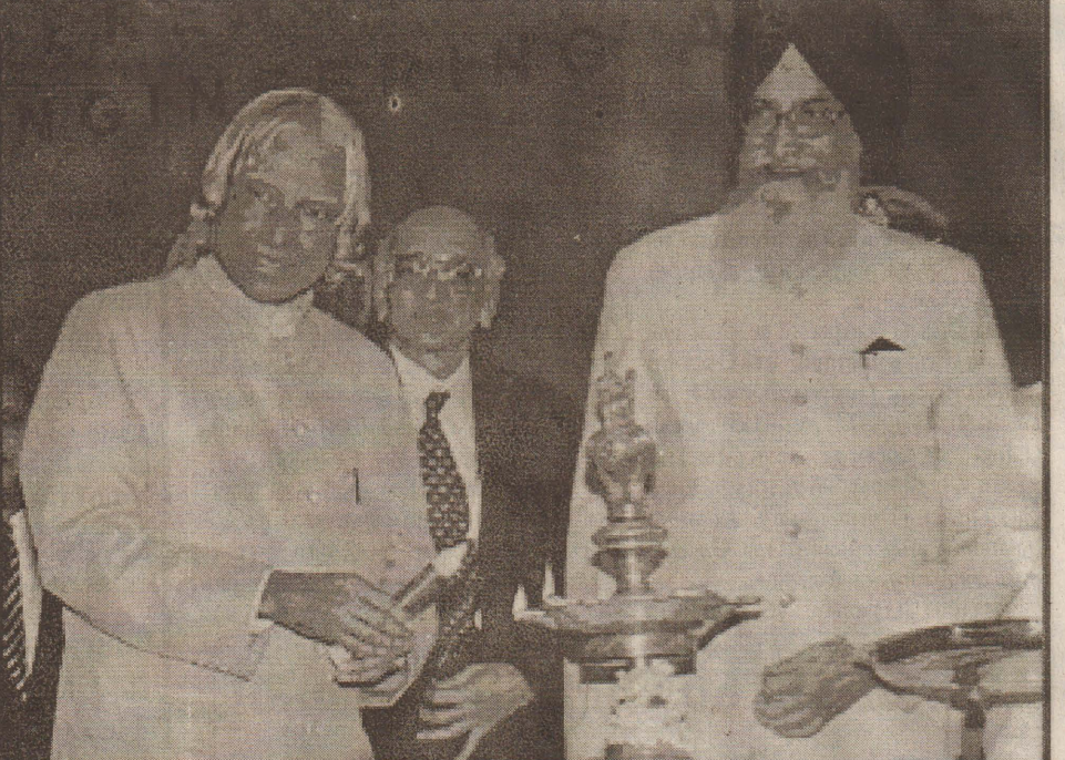
சென்னை ஐ.ஐ.டி.யில் நடந்த கம்ப்யூட்டர் முலம் கணக்கீடுதல் சோதனை பொறியியல் அறிவியல் மாநாட்டை ஜனாதிபதி அப்துல் கலாம் குத்துவிளக்கேற்றி தொடக்க வைத்தார். அருகில் கவர்னர் கர்ஜித் சிங் பர்னாலா.