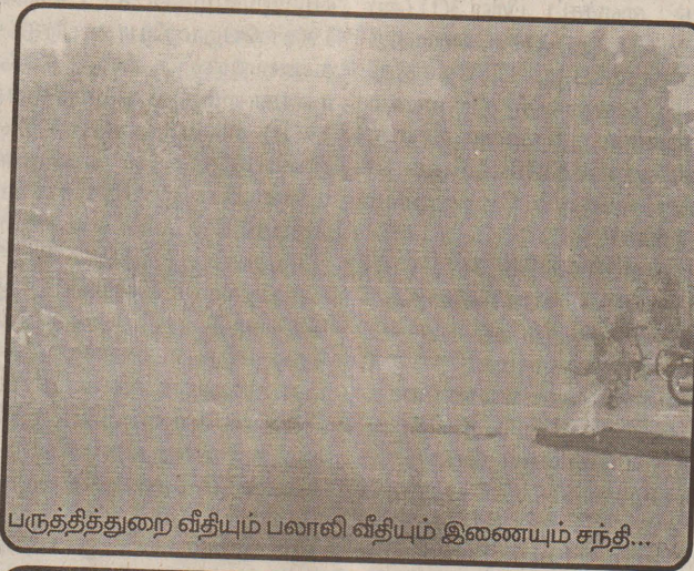
பருத்தித்துறை வீதியும் பலாலி வீதியும் இணையும் சந்தி...