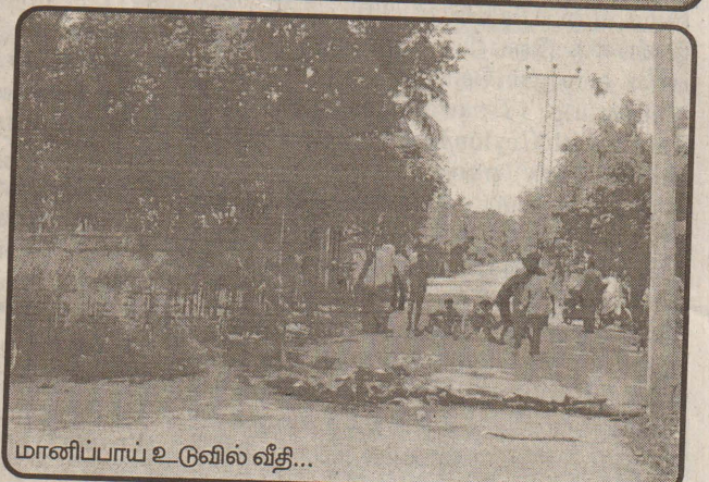
மானிப்பாய் உருவில் வீதி...