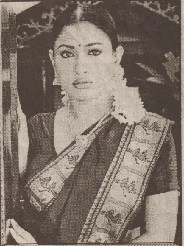
'பாசக்களிகள்' - மாளவிகா