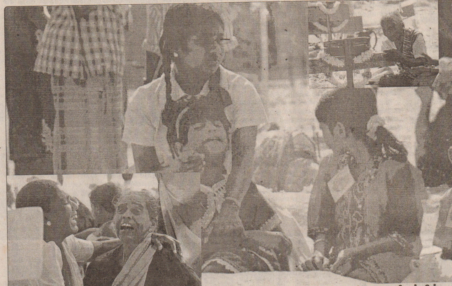
வடமராட்சி கிழக்கில் இடம் பெற்ற ஆழிப்பேரலை அனர்த்த ஓராண்டு நினைவு நிகழ்வில்...

ஈடுபடுவார்கள் எனத் தெரிவிக்கப்பட்டது. யாழ்.பல்கலைக்கழகம் எதிர்வரும் இரண்டாம் திகதிவரை மூடப்பட்டுள்ளமை குறிப்பிடத்தக்கது. இதேவேளை அரசு ஊழியர்களின் பணிப்புறக்கணிப்பு தொடருமானால் யாழ்ப்பாணத்தில் இயல்பு வாழ்க்கை முற்றாகப் பாதிப்படையும் நிலை உருவாகுமெனவும் அதற்கு முன்பதாக அரசாங்கம் உரிய நடவடிக்கை யெடுக்க வேண்டும் எனவும் பல்வேறு அமைப்புகளும் வேண்டுகோள் விடுத்துள்ளன. (ச-132-4)