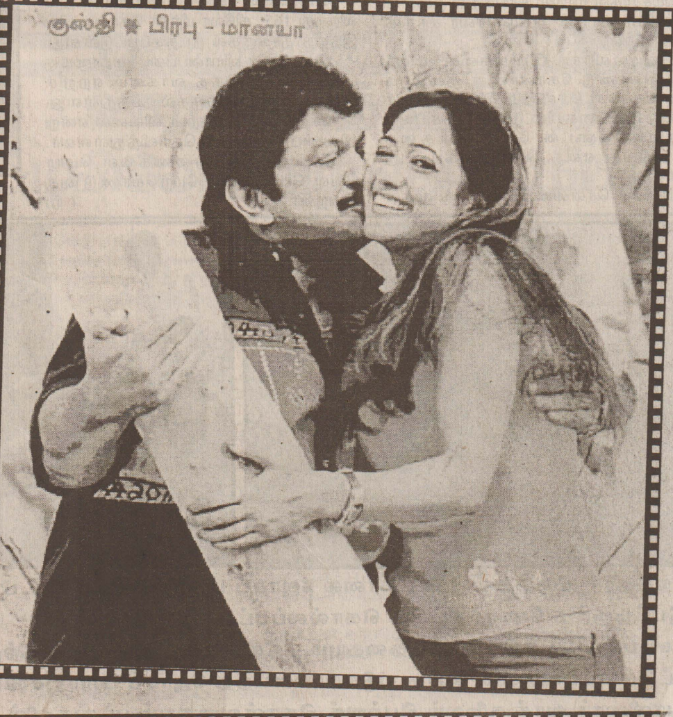
குஸ்தி பிரபு - மாளவிகா

நிலாவின் உண்மைப் பெயர் மீராசோப்ரா. அந்தப் பெயரிலேயே நடிக்கிறார். எஸ்.ஜே.சூர்யா வைத்த பெயர் மீது என்ன கோபமோ..?