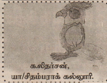
கலிதாசன், யா/சிதம்பராக் கல்லூரி.