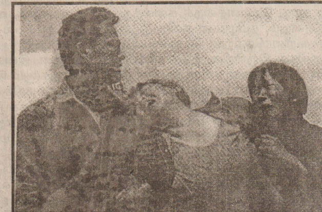
சீனாவில் ஹீலாங்ஜியாங் மாகாணத்தில் கடந்த சில நாட்களாக பலத்த மழை பெய்து வருகிறது. இதனால், நிங் ஆன் நகரம் அதனை சுற்றியுள்ள கிராமங்கள் வெள்ளத்தில்

(பீஜிங்) சீனாவில் தொடர் மழையால் ஏற்பட்ட பெரு வெள்ளத்தில் சிக்கி மள்ளிக் குழந்தைகள் 87பேர் உட்பட 400பேர் பலியாகியுள்ளனர். இத்தொகை மேலும் அதிகரிக்கலாமென அஞ்சப்படுகிறது. தால் குழந்துள்ளன. இங்குள்ள கிராமத்தில் 55விடுகள் வெள்ளத்தில் அடித்துச் செல்லப்பட்டன. இதே பகுதியில் உள்ள ஆரம்ப பள்ளியில் 350 குழந்தைகள் படித்து வந்தனர். 31 ஆசிரியர்கள் பணியில் இருந்தனர். இந்தப் பள்ளியை ஆறடி உயரத்துக்கு வெள்ள நீர் சூழ்ந்ததில் சுவர் இடிந்து விழுந்தது. இந்த சம்பவத்தில் 87பள்ளிக் குழந்தைகள் உட்பட 91பேர் பலியாயினர். சம்பவ இடத்தை ஹீலாங் ஜியாங் மாசான கவர்னர் பார்வையிட்டு நிவாரணப் பணிகளை விரைவுபடுத்தியுள்ளார். தெற்கு சீனாவில் சூந்த சில வாரங்களாக பெய்துவரும் பலத்த மழையினால் பல நதிகளில் வெள்ளம் அபாயக்கடத்ததைத் தாண்டி உடைப்பெடுத்துள்ளன. 400எக்கும் அதிகமானவர்கள் பலியாகியுள்ளனர். ஒரு இலட்சத்து ஆயிரம் விடுகள் சேதமடைந்துள்ளதாகத் தெரிவிக்கப்படுகின்றது. (று)