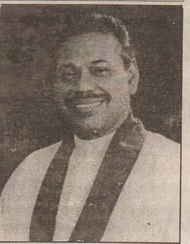
குவதற்கான காலம் கனிந்துள்ளதாகவும் பிரதமர் கூறினார். (கு-9)

(கொழும்பு) மக்கள் பயம், சந்தேகம் என்பன இல்லாமல் நிம்மதியாக வாழக் கூடிய குழுவை உருவாக்க வேண்டிய காலம் வந்துள்ளதாகவும் நாட்டின் அனைத்து மக்களும் நிரந்தர சமாதானத்தை எதிர்பார்த்திருப்பதாக பிரதமர் மஹிந்த ராஜபக்ஷ குறிப்பிட்டுள்ளார். வரலாற்றுச் சிறப்புமிக்க ரத்மலிஹந்த விகாரையில் அமைக்கப்பட்ட புத்தர் சிலையைத் திறந்து வைத்து உரையாற்றும் போதே பிரதமர் இதனைத் தெரிவித்தார். சிங்களவர்கள், தமிழர்கள், முஸ்லிம்கள், பூங்காயர்கள் ஆகிய அனைவரும் நாட்டின் சமாதானத்தை ஆவலுடன் எதிர்பார்ப்பதாகவும் அவர் குறிப்பிட்டார். நாட்டில் சந்தேகமும், பயமும் அற்று ஒற்றுமையுடன் நிம்மதியாக வாழக்கூடிய நிலையை உருவாக்க