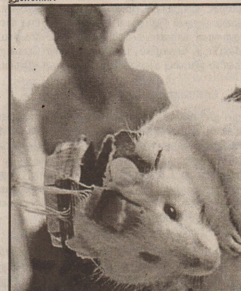
தால், எலி வலகூறுமாகத் திரும்பி நிற்க்கு. கம்பியூட்டரில் என்ன கட்டளை பிறப்பித்தாலும் எலி அதன்படியே செயல்படுகிறது. ஆராய்ச்சிக்கு பயன்படுத்தப்பட்ட அந்த அதிசய வெள்ளை எலியைப் படத்தில் காணலாம்.