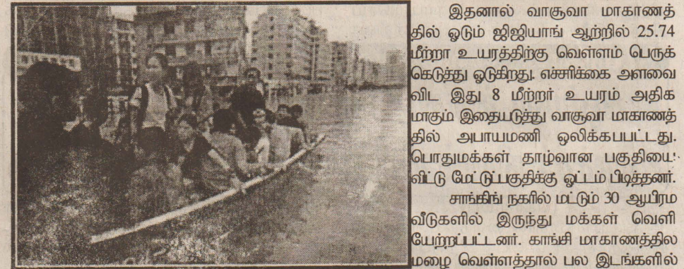
(புஜிங்) சீனாவில் ஏற்பட்ட தொடர்மழை - நிலச்சரிவால் 60 பேர் உயிரிழந்துள்ளனர்.

சீனாவின் தென்பகுதியில் கனமழை பெத்து வருகிறது. அங்குள்ள வாகுவா, சாங்கிய, காங்சி ஆகிய 3 மாகாணங்களில் வீதிகளில் மழை வெள்ளம் புகுந்துவிட்டது.