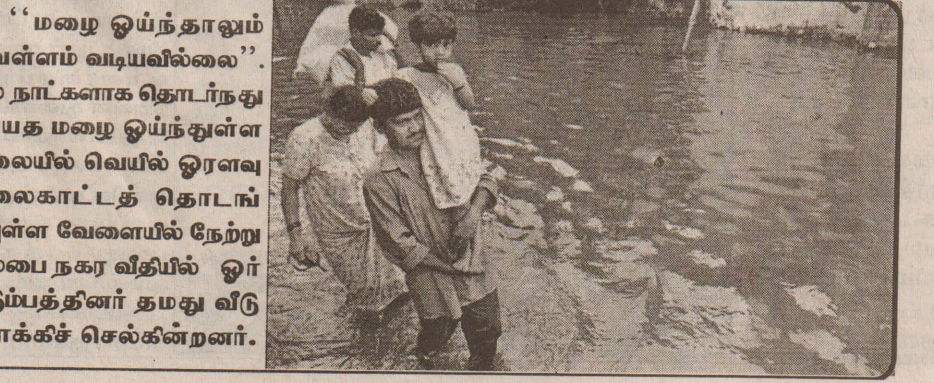
“மழை ஓய்ந்தாலும் வெள்ளம் வடியவில்லை”. பல நாட்களாக தொடர்ந்து பெய்த மழை ஓய்ந்துள்ள நிலையில் வெயில் ஓரளவு தலைகாட்டத் தொடங்கியுள்ள வேளையில் நேற்று மும்பை நகர வீதியில் ஓர் குடும்பத்தினர் தமது வீடு நோக்கிச் செல்கின்றனர்.

அவர்களிடம் பயங்கரவாத எதிர்ப்பு பொலிஸார் துருவித் துருவி விசாரணை நடத்தி வருகிறார்கள். அவர்களை பின்னணியில் இருந்து இயக்கும் தலைவர்கள் யார் என்பதை அறியும் முயற்சியில் இலண்டன் பொலிஸார் தீவிரமாக ஈடுபட்டுள்ளனர். (று)