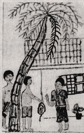
T. Januya (10B)

Ah! What a sound! The tree fall on the kitchen roof. All the tiles of kitchen were broken. The tree fall down into the kitchen and damaged the things of the kitchen. The mother in the kitchen ran out and shouted. "What happened?" No answer. She looked the father and the two men fall down with rope. Then they stood up and saw the trunk on the kitchen roof. The father turned and saw the two men angrily. The men without making payment ran out fast.