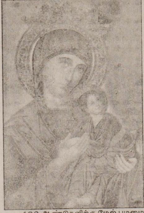
460 ஆண்டுகளிற்கு மேல் பழமை வாய்ந்த மருதமடு அன்னையின் திருவிழா இன்று திங்கட்கிழமை மன்னார் மடு மாதா ஆலயத்தின் அபிசேகம் செய்யப்பட்டது.