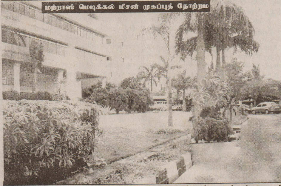
மற்றாஸ் மெடிக்கல் மிசன் முகப்புத் தோற்றம்