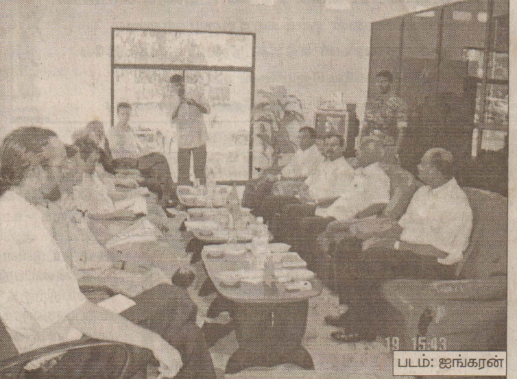
19 15:43