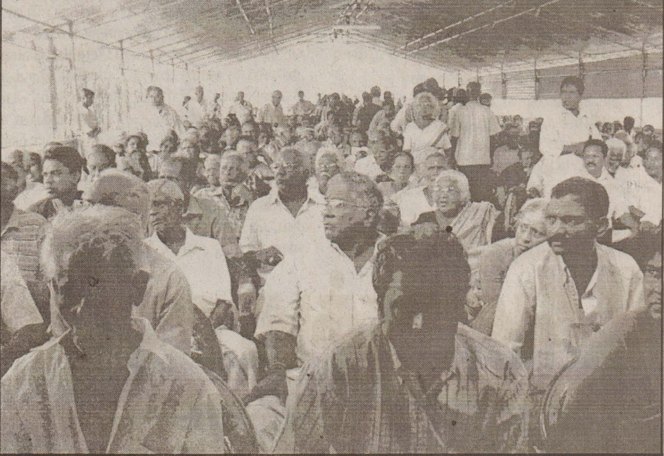
கடந்த வெள்ளிக்கிழமை பனையில் இடம்பெற்ற தமிழீழ மீட்பு நிதிக்கடன் மீளளிப்பு நிகழ்வில் கடன் மீளிக்கொடுவதையும், இதற்காக சென்றிருந்த பொதுமக்களையும் பாடங்களில் காணலாம்.