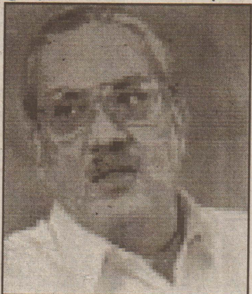
பண்டாரநாயக்க குடும்பத்தை இலங்கை வாழ் மக்கள் எவரும் மறக்கமாட்டார்கள்.

தும் ஸ்ரீலங்கா சுதந்திரக்கட்சியின் இதயத்தினை உடைப்பதற்கு முயற்சிகளைச் செய்கின்றனர்.