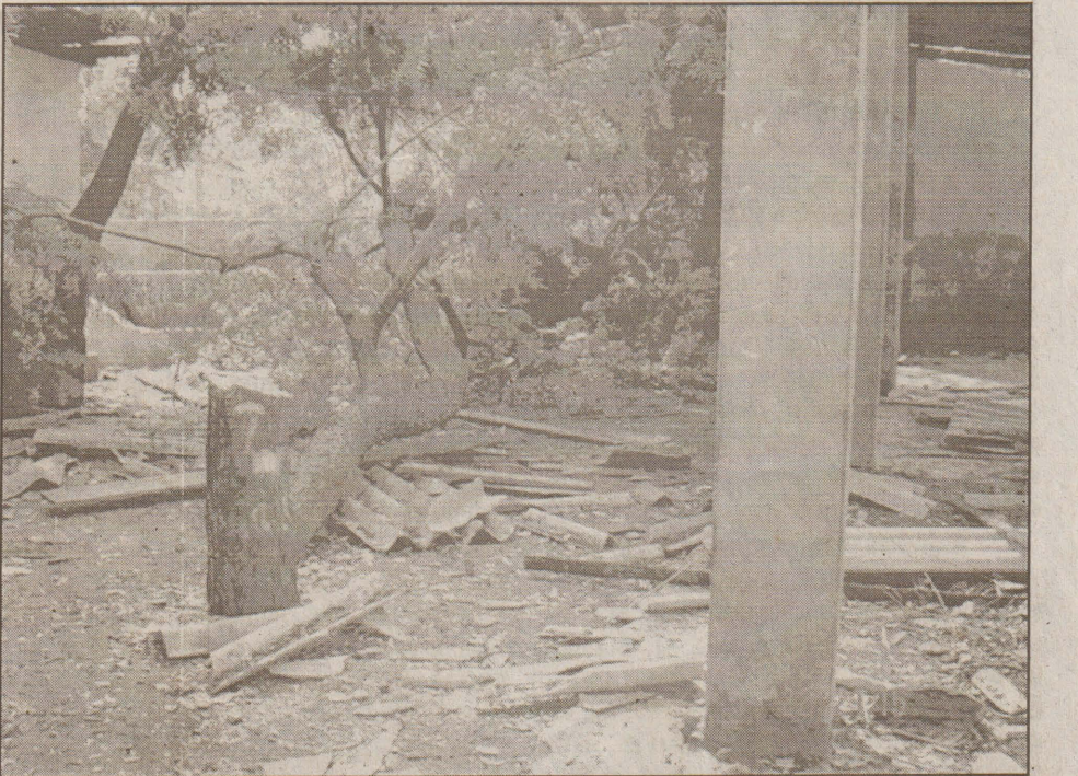
நல்லூர் பிரதேச சபையின் கொக்குவில் உப அலுவலகம் நேற்று கிளைஞர் குழுவால் அடித்து நொருக்கப்பட்டது. கொக்குவில் பகுதியில் நேற்று முன்தினம் கிரவு காணாமல் போன மாடு ஒன்றினை கிளைஞர் சபை போடுவதற்கு கிப் பிரதேச சபை அனுமதி வழங்கியதற்காகவே அடித்து நொருக்கப்பட்டது. (19)