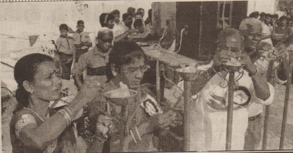
மன்னாரில் நேற்று நடைபெற்ற எழுச்சிப்பிரகடன நிகழ்வில் எழுச்சி கூடேற்றப்படுவதை படத்தில் காணலாம்

மரண விசாரணையின் பொருட்டு சடலம் யாழ்.பொலிஸாரினால் நேற்று யாழ். போதனா வைத்திய சாலையில் ஒப்படைக்கப்பட்டது. இதே வேளை சந்தேகநபர் தலைமறைவாகியுள்ளதாக தெரிவிக்கப்பட்டது. (து-130)