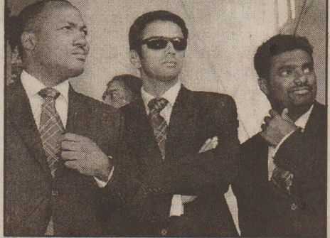
பிரட் ஹாக், வேகப்பந்து வீச்சாளர் ஷான் டைட் ஆகிய இருவரும் சுயம் காரணமாக விலகினார்கள். இதனால் இவர்களுக்குப் பதிலாக

ஆஷஸ் தோல்விக்குப் பின்பு மீண்டும் ஒரு மாபெரும் சவாலை அவுஸ்திரேலியா சந்திக்க உள்ளது. இந்நிலையில் அவுஸ்திரேலிய அணியில் இடம்பெற்றிருந்த சுழற்றி வீச்சாளர்