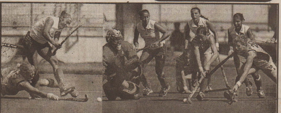
இந்திராகாந்தி தங்க கோப்பை மகளிர் ஹாக்கிப் போட்டியில் நேற்றுமுன்தினம் நியூஸிலாந்து - இத்தாலி அணி வீரர்களைக் கோபுர ஆட்டத்தின் பரபரப்பான காட்சி.