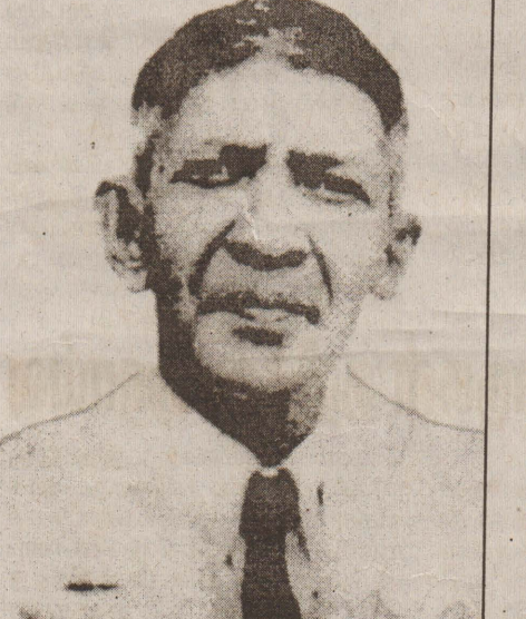
தலைமையில் உருவாகியது பெடரல் பாட்டி என ஆங்கிலத்தில் கூறப்பட்ட தமிழரசுக் கட்சி வடக்கு கிழக்கை கிணைத்து, ஒரு பிரதேசமாக சமஷ்டி முறையிலான ஆட்சியமைப்பின் கீழ் கொண்டு வர வேண்டும் என்ற திட்டத்தை 1951 கில் பிரஸ்தாபித்தார்கள் தமிழரசுக்கட்சியினர்.

இதற்கிடையில் ஐக்கிய தேசியக் கட்சியில் தொடர்ந்தும் கிருந்தால் தனக்கு தலைமைப்பதவி கிடைக்க வாய்ப்பில்லை என்பதை உணர்ந்துகொண்ட பண்டாரநாயக்க, அதிலிருந்து விலகி, ஸ்ரீலங்கா சுதந்திரக் கட்சியை ஆரம்பித்தார். 1958 கில் பொதுத் தேர்தல்