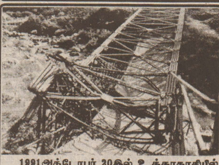
1991 அக்டோபர் 20கில் உத்தரகாசியில் ஏற்பட்ட நிலநடுக்கத்தில் தலைகுப்புற கவிழ்ந்த கவானா பாலம்.