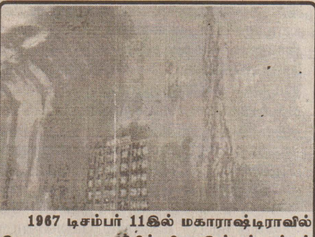
1967 டிசம்பர் 11கில் மகாராஷ்டிராவில் கொயானா பகுதியில் நிலநடுக்கம் ஏற்பட்டது. அப்போது அணையில் ஏற்பட்ட கீறல்களால் தண்ணீர் கசிந்தது.