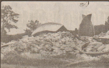
1897 ஜூன் 12கில் அசாமில் ஏற்பட்ட நிலநடுக்கத்தில் அனைத்து புனிதர் தேவாலயம் நொறுங்கி விழுந்தது.