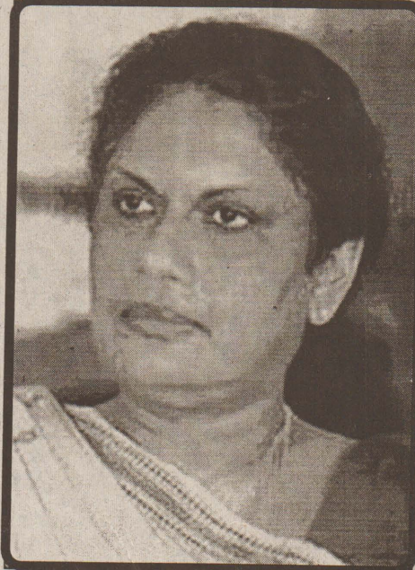
பான்மை புகழ் சேர்க்கும் விடயம் என்றாலும் சிறுபான்மை இனங்களை நாட்டை விட்டு வெளியேற்றும் இனவாத சக்திகளுக்கான குரலாக இவர் ஒலித்ததற்கே கிறித்தம் பட்டம் கிவருக்கு கிடைத்தது.

கிவருக்கு எதிராக கிரண்டு கொலை குற்றச் சாட்டுக்கள் கிருக்கின்றன. தனது அரசியல் பலத்தை பிரயோகித்து கிறித்தம் வழுக்குகளுக்கும் முடிவைத் தருகின்றார் இவர். ஏனைய குற்றச் சாட்டுக்கள் ஏராளம். இவர் தொழில்பார்த்த கிடம் ஒன்றும் சாதாரணமானதல்ல. சிங்கள இனவெறிக்கு அடி அத்தீவரமும் தூபமு