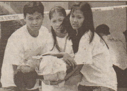
மணிலாவில் தீவிரவாதிகள் பள்ளி மீது நடத்திய தாக்குதலில் பல மாணவர்கள் காயமடைந்தனர். காயமடைந்த மாணவன் ஒருவனை மீட்புப் பணியினர் சிகிச்சைக்காக டூக்கிச்செல்லும் காட்சி.

டதால் மீட்புப் பணிகளும் இன்னும் மீட்புப் பணிகளும் அமுக்குதொடங்கி விட்டன. இதனால் துர்நாற்றம் வீசி தொற்று நோய் ஏற்படும் அபாயம் ஏற்பட்டுள்ளது. இன்னும் பூகம்பப் பகுதிகளில் இருந்து பொது மக்கள் வெளியேற்றப்பட்டு விடுகிறார்கள். (ர)