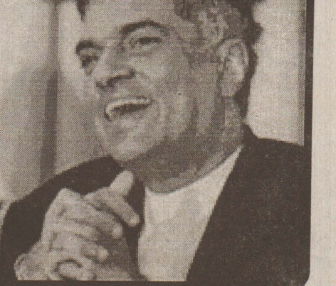
ஜே.வி.பிபின் நபந்தனைகளுக்கு கிணங்கி, பாமர சிங்கள கிராமவாசிகள் வாக்கைப் பெறுவது-ஹெல் உறுமயவின் நபந்தனைகளை ஏற்றுக் கொண்டு பௌத்த மேலாதிக்கத்தினரின் வாக்குகளையும் அள்ளுவது-பிரபாகரனுடன் நேரே பேசப் போகிறேன் என்று கூறி தமிழரின் முதுகிலும் குத்துவது என்று இவர் எடுத்த நடவடிக்கைகள் முதற்படியிலேயே, ஒரே சறுக்கலாக உள்ளது.

வேறொன்றும் கூறும் கிவரது யுக்தி கைகூட மறுக்கிறது.