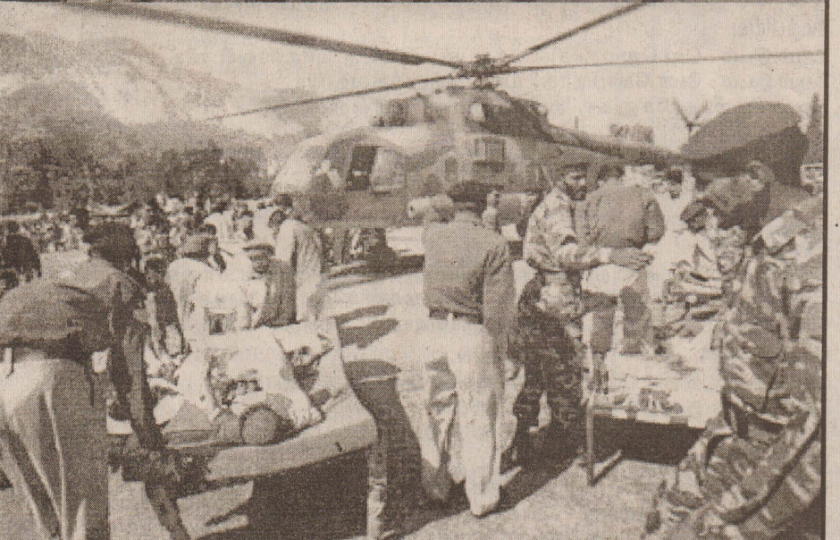
பாகிஸ்தானில் மீட்புப் பணிகளில் பன்னாட்டு அமைப்புகளும் ஈடுபட்டு வருகின்றன. எனினும், தொடர்ச்சியாக அங்கு மழை பெய்து வருகின்றமையால் மீட்புப் பணிகளில் தாமதம் ஏற்பட்டுள்ளது. மீட்புப் பணிகளில் ஈடுபட்டுள்ள கிராணுவத்தினர்...