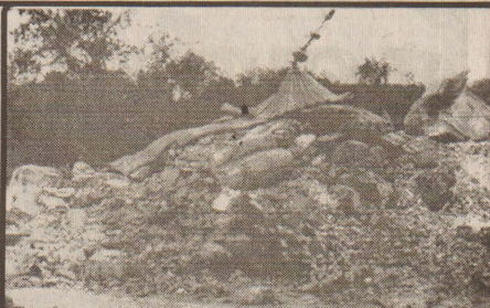
1905 ஏப்ரல் 4கில் இமாச்சல் பிரதேசத்தில் உள்ள கங்காவில் ஏற்பட்ட நிலநடுக்கத்தில் கோயில் கிடந்து தரைமட்டமானது.