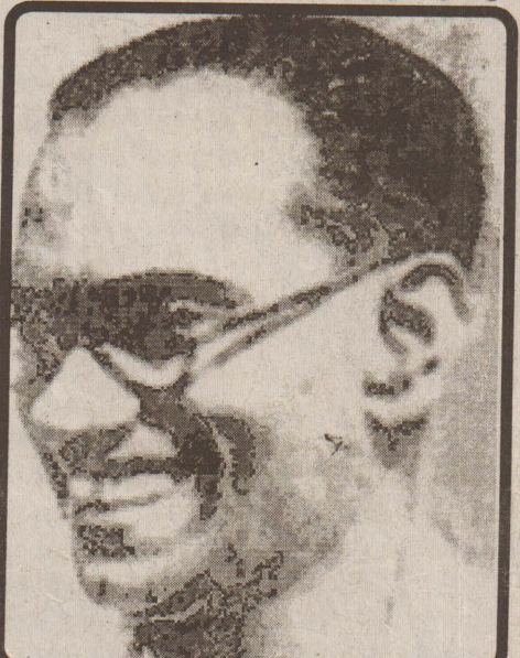
மிட்ட துட்டகைமுனு வம்சத்தின் மண் என்றும், பௌத்த சிங்கள அடிப்படைவாதிகளின் மண் என்றும் கருதப்படும் தங்காலை என்ற சிங்களக் கிராமமே, மஹிந்த ராஜபக்ஷ சட்டத் தரணியாக தொழிலாற்றிய பிரதேசம். கிங்கு கிளத்துவேசத்தை யாரும் புத்தாக விதைக்கும் அவசியமில்லை, அவ்வளவிற்கு அது விளைந்து போயிருக்கிறது.

கிவருக்கு எதிராக கிரண்டு கொலை குற்றச் சாட்டுக்கள் கிருக்கின்றன. தனது அரசியல் பலத்தை பிரயோகித்து கிறித்தம் வழுக்குகளுக்கும் முடிவைத் தருகின்றார் இவர். ஏனைய குற்றச் சாட்டுக்கள் ஏராளம். இவர் தொழில்பார்த்த கிடம் ஒன்றும் சாதாரணமானதல்ல. சிங்கள இனவெறிக்கு அடி அத்தீவரமும் தூபமு