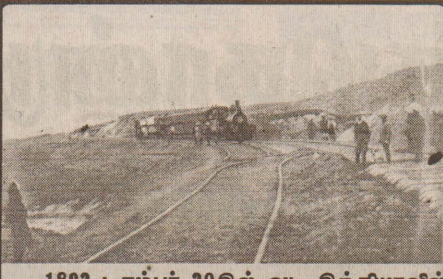
1892 டிசம்பர் 20கில் வட இந்தியாவில் சாமன் பகுதியில், சென்று கொண்டிருந்த ரயில் நிலநடுக்கத்தால் வழியிலேயே நன்று விட்டது.