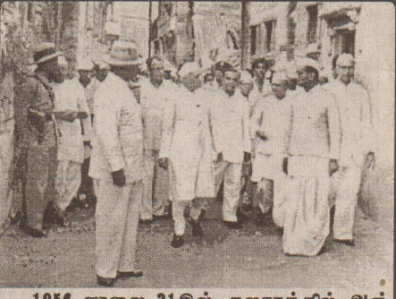
1956 ஜூலை 21கில் குஜராத்தில் அஞ்சார் பகுதியில் ஏற்பட்ட நிலநடுக்க சேதங்களை பார்வையிட்ட பிரதமர் நேரு.