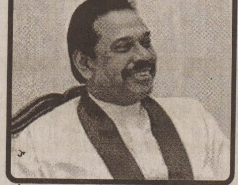
டின உரிமைகளைப் பிரித்துக் கொள்ளலாமே என்று ஜி.ஜி.பொன்னம்பலம் கேட்டபோது, அதை மறுத்த டி.எஸ்.சேனநாயக்க, அதற்குப் பதிலாக 80க்கு 40 என்று பிரித்துக்கொண்டு ஆட்சி அமைக்கும் திட்டத்தை முன்மொழிந்தார். கிது வேண்டாம், தருவதாக கிருந்தால் 50க்கு 50 தான் என்று அடம்பிடித்தவர் ஜி.ஜி.பொன்னம்பலம். கிது வரலாறில் பழைய கதை தான். கிது எப்படியோ தூசுதட்டி, அவ்வப்போது பாட்டி கதை போல திரிக்கும் கழிக்கும் கிணைக்கும் குறைத்தும், சிங்கள மக்களை திசை திருப்பும் நடவடிக்கைக்காக பாவித்து வருகிறார்கள் சிங்களப் பேரினவாதிகள்.