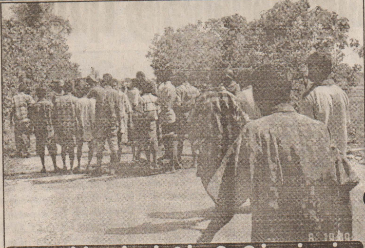
ஆர்ப்பாட்டத்தில் ஈடுபடும் மக்கள்