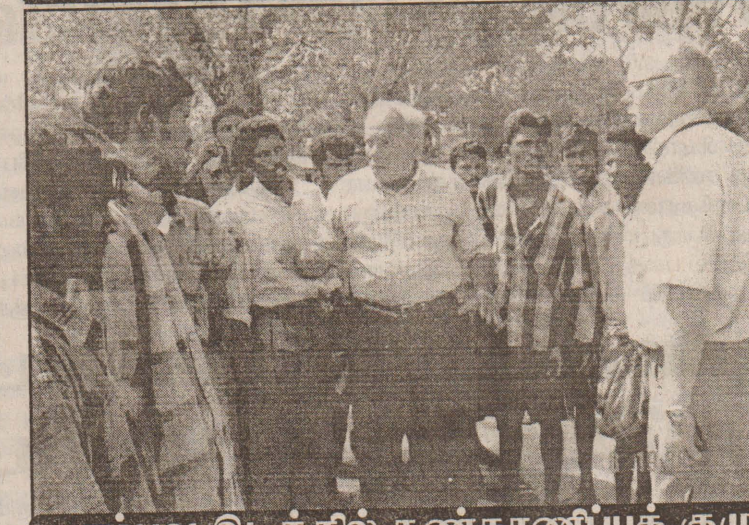
சம்பவ இடத்தில் கண்காணிப்புக் குழு