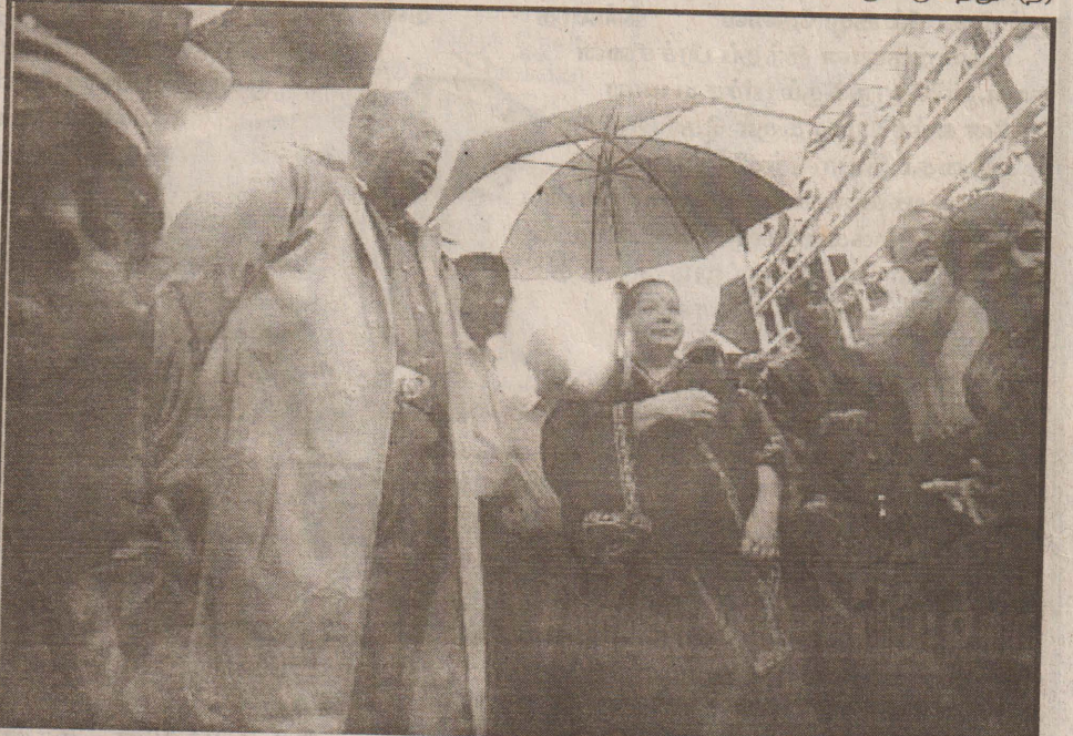
திருவல்லிக்கேணி பார்த்தசாரதி கோவில் தெப்பக்குளம் நிரம்பி இருப்பதை தமிழக முதல்வர் ஜெயலலிதா நேற்று முன்தினம் பார்வையிட்டார்.

அண்ணா நகர், முகப்பேர், கொரட்டூர் ஆகிய பகுதிகளில் அடுக்கு மாடிகுடியிருப்புகளில் தண்ணீர் தேங்கி நிற்கிறது. அவை வெளியேற்றப்பட்டு வருகிறது. சுரங்கப்பாதைகளில் தேங்கி நிற்கும் தண்ணீர் மோட்டார் 'பம்பு' மூலம் வெளியேற்றப்பட்டு வருகிறது. (ஈ)