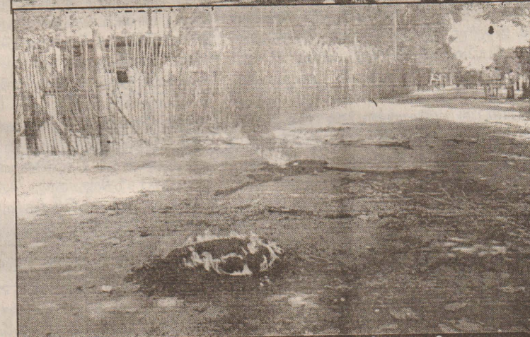
முகாமிற்கு முன் ரயர் எரிப்பு