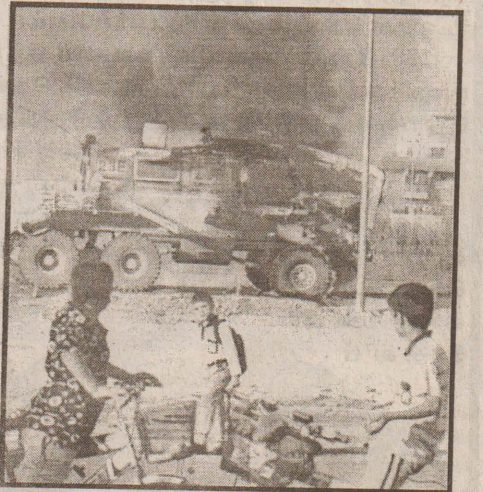
கன் பணயக்கைதியாகப் பிடித்துவைத்துள்ளனர்.

ஷியா பிரிவினருக்கு கூடுதல் சலுகைகள் கிடைப்பதால் சன்னி பிரிவினரின் தாக்குதல் மேலும் அதிகரித்துள்ளது. நேற்று முன்தினம் பக்தாத்தில் சன்னி-ஷியா பிரிவினருக்கிடையிலான மோதலில் 21 ஷியா முஸ்லிம்கள் கொல்லப்பட்டனர். ஷியா பிரிவு தலைவர் ஒருவரை சன்னி பிரிவு தீவிரவாதிகள் பணயக்கைதியாகப் பிடித்துவைத்துள்ளனர்.