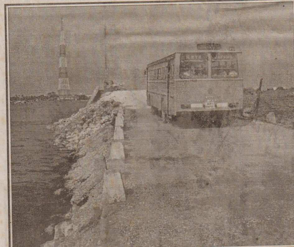
பண்ணைப் பாலம் போக்குவரத்திற்காக திறந்து வைக்கப் பட்டதையடுத்து, அதன் ஊடாக வடபிராந்திய போக்குவரத்துச் சபையின் பஸ் சேவையில் ஈடுபடுவதைக் காணலாம்.

இதன் முன்னோடிக் கலந்துகொள்வதற்கும் முல்லை மாவட்டத்தில் நடைபெற்ற வருகின்றன. இதனை முன்னிட்டு ஒட்டுகூட்டான பிரதேச கழகங்களுக்கிடையில் நடாத்தப்படவுள்ள உதைபந்து, கரப்பந்து (ஆண், பெண்) கபடி(ஆண், பெண்) மென்பந்து வலைப்பந்து ஆகிய போட்டிகள் இன்று காலை ஆரம்பமாகவுள்ளன. (10-4)