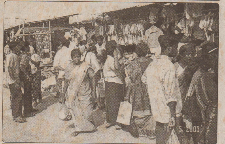
தீபாவளி பண்டிகையை முன்னிட்டு யாழ். நகரப் பகுதியில் உள்ள நடைபாதை நிலையங்கள், புடவை வியாபாரம் களை கட்டியுள்ளது. அதனையே படத்தில் காணலாம்.

இரண்டு பிள்கைளின் தந்தையான இவருக்கு அடுத்த வருடம் மேமாதம் (12 ஆம் பக்கம் பார்க்க)