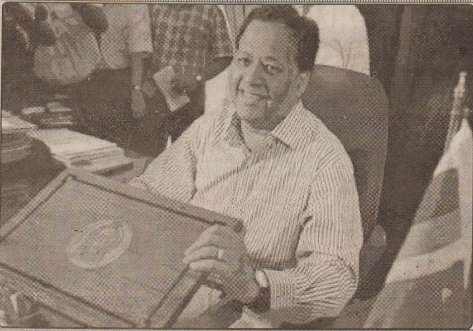
அரசாங்கத்தின் வரவு - செலவுத் திட்டம் இன்று சமர்ப்பிக்கப்படுவதை முன்னிட்டு அதற்கான ஆயத்த நடவடிக்கைகளில் நிதியமைச்சர் சரத் அமுலுக்கம் ஈடுபட்டிருப்பதைப் படத்தில் காணலாம்.