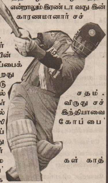
சதம் . விருது சச்சின் இந்தியாவை கோப்பை