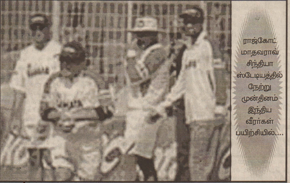
ராஜகோட் மாதவராவ் சிந்தியா ஸ்டேடியத்தில் நேற்று முன்தினம் இந்திய வீரர்கள் பயிற்சியில்....