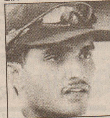
அணியைப் பாதிக்காது என இந்தியக் கிரிக்கெட் அணியின் தலைவர் சௌரவ் கங்குலி தெரிவித்துள்ளார். (யே-68)

அவுஸ்திரேலியாவில் நடைபெற்று வரும் முக்கோண ஒருநாள் சர்வதேச கிரிக்கெட் போட்டியில் அஷல திரேலிய அணிக்கெதிராக கடந்த ஞாயிற்றுக்கிழமை நடைபெற்ற கடைசி லீக் போட்டியில் இந்திய அணியினர் அடைந்த தோல்வியானது அவுஸ்திரேலியாவுடன் நடைபெறவுள்ள இந்தப் போட்டித்தொடரின் இறுதி ஆட்டங்களில் இந்திய