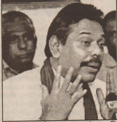
போதே மகிந்த ராஜபக்ஷ இதனைத் தெரிவித்தார்.

எதிர்காலத்தில் நடைபெறும் எந்தவொரு தேர்தலிற்கும் முகம் கொடுக்கும் வகையில் ஸ்ரீலங்கா சுதந்திரக் கட்சியை பலப்படுத்த வேண்டும் என எதிர்க்கட்சித் தலைவர் வா மகிந்தராஜபக்ஷ ஆலோசனை கூறியுள்ளார்.