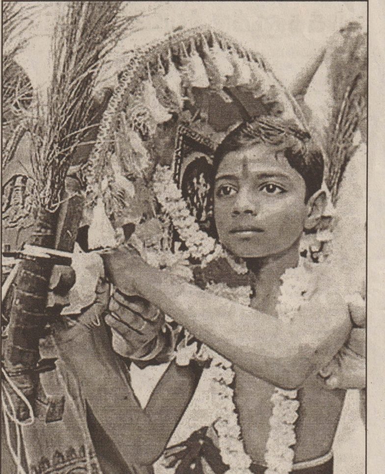
தைப்பூசம் திருநாளையொட்டி சிங்கப்பூரில் புதன்கிழமை காவடி எடுத்த தமிழ்ச் சிறுவன். காவடி எடுக்கும் தமிழர் பண்பாடு அக்கரைச் சீமையிலும் ஆண்டாண்டுகளாய்த் தொடர்கிறது.