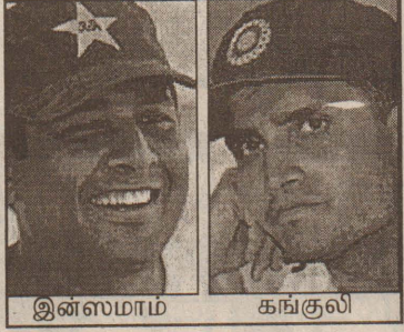
இன்ஸமாம் கங்குலி திய அணி இந்தப் போட்டிகளை முடித்துக் கொண்டு ஏப்ரல் மாதம் 18ஆம் திகதி இந்தியா திரும்புவது. இப்போட்டி தொடர்பான போட்டி விபரங்கள் நேற்று வெளியிடப்பட்டுள்ளன.

அணி ஒரு பயிற்சிப் போட்டியிலும் 5 ஒருநாள் மற்றும் 3 டெஸ்ட் போட்டிகளிலும் விளையாடவுள்ளது. இந்