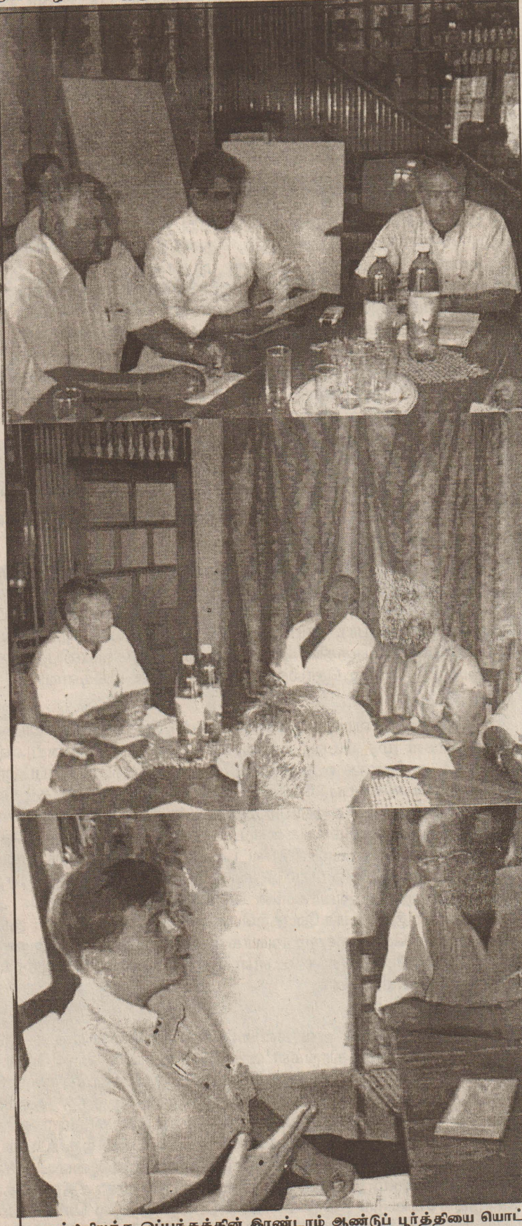
யுத்தநிறுத்த ஒப்பந்தத்தின் கிரண்டாம் ஆண்டுப் பூர்த்தியை யொட்டி யாழ்.மாவட்ட மன்றைய அமைப்புக்களின் பிரதிநிதிகள் யுத்த நிறுத்த கண்காணிப்புக்குழு அதிகாரிகளைச் சந்தித்து மகஜர் ஒன்றை கையளித்து உரையாடுதல் செய்துள்ளார்கள். (யே-60,10)

சுகாதார அமைச்சினால் ஒவ்வொரு சிகிச்சை நிலையங்களிலும் சிறுவர்களினதும், தாய்மார்களினதும் போஷாக்கை மேம்படுத்தும் நோக்கில் சோயாமா, முக்கூட்டு மா மற்றும் அயன் விறற்றின் மாதிரைகள் ஒவ்வொரு மாதமும் வழங்கப்பட்டு வருகின்றது. இதனை உரிய முறையில் பயன்படுத்துவதன் மூலம் இலகுவாக போஷாக்கை மேம்படுத்த முடியும் எனவும் இவை மூலம் விஷைமாக தயாரிக்கக் கூடிய உணவு வகைகள் பற்றியும் தெளிவாக விளக்கினார். (யே-252)