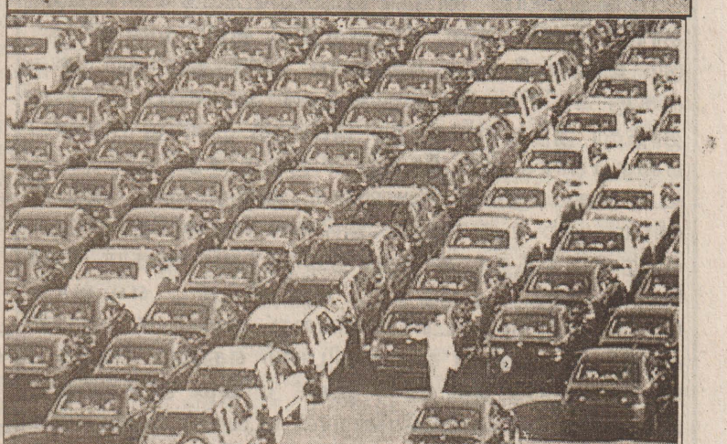
ஜப்பான் தலைநகர் டோக்கியோவில் இருந்து ஏற்றுமதி செய்வதற்காக நிறுத்தி வைக்கப்பட்டுள்ள கார்களின் அணிவகுப்புதான் இது. கார்கள் மற்றும் பல்வேறு தயாரிப்புகளின் ஏற்றுமதியால்தான் ஜப்பானின் பொருளாதாரம் வளர்ச்சியடைந்து வருகிறது.