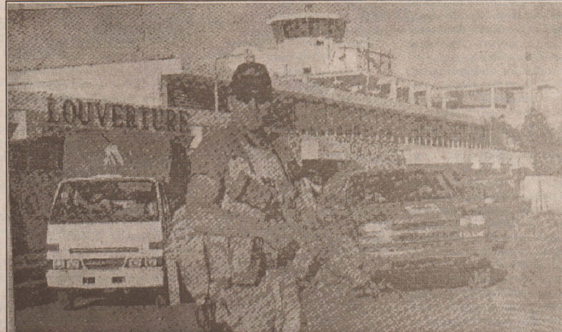
ஹெய்டிடி ஜனாதிபதி அரிஸ்டரைட் நாட்டைவிட்டுத் தப்பியோடியுள்ள சூழ்நிலையில் தலைநகரில் அமைந்துள்ள சர்வதேச விமான நிலையத்தில் கண்டா நாட்டு வீரர் ஒருவர் பாதுகாப்பு வழங்கியபோது.

இப் பேச்சு வார்த்தைகளின் போது ஐக்கிய நாடுகள் சபையின் பொதுச் செயலாளர் கோபி அனானின் ஜோஸை பேசி அழைப்புக்களை பிரித்தானிய உளவுப் பிரிவினர் ஒட்டுக் கேட்டமை தொடர்பாகவும் ஆராய்வர்கள் எனத் தெரிவிக்கப்படுகின்றது. (9)