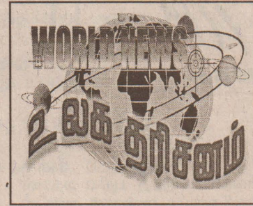
2 வக துரிசனம்

பலஸ்தீனப் பகுதிகளில் அமைக்கப்பட்டுள்ள சட்ட விரோதக் குடியேற்றங்களை அகற்றும் திட்டத்திற்கு அமெரிக்கா வின் ஆதரவைக் கோரி நிற்கும் இஸ்ரேல், பலஸ்தீன் போராளி களுக்கு எதிராக கடுமையான மேற்கொள்வதற்குத் திட்டமிட்டுள்ளதாக அறிவிக்கப்பட்டுள்ளது. (து)