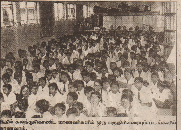
இதில் கலந்துகொண்ட மாணவர்களில் ஒரு பகுதியினரையும் பட்டங்களில் காணலாம்.

சுதந்திரமாக வாக்களிப்பது எல்லா மக்களுக்கும் ஒரு ஜனநாயக உரிமை. இந்த உரிமையை சரியான விதமாகப் பயன்படுத்தவேண்டிய கடமை எல்லோருக்கும் உண்டு. தமிழ் மக்கள் இந்தப் பொன்னான வாய்ப்பை நழுவ விடாமல் அனைவரும் நேர்மையான வாக்களிப்பில் ஈடுபட வேண்டும். போரை அல்ல அமைதியையும், சமாதானத்தையுமே தமிழ் மக்கள் விருங்குகிறார்கள் என்பதை முழு சிவதேச உலகிற்கும் வெளிக்காட்ட தமிழ் மக்கள் அனைவரும் ஒன்றிணைந்து சரித்திரம் படைக்க வாக்களிப்பில் ஈடுபட வேண்டும் என விரும்புகிறோம். யாரும் வாக்களிப்பில் ஈடுபடாமல் இருக்கவேண்டாம். குறிப்பாக இடம்பெயர்ந்தவர்கள் விசேட வாக்களிப்பு நிலையங்களுக்குச் செல்லவேண்டியிருப்பதனால் இச் சிரமங்களைக் கண்டு பின்வாங்காமல் இவ் இடங்களுக்குத் தவறாமல் சென்று வாக்களிப்பில் ஈடுபட வேண்டுகிறோம். வாக்குகளை அளிக்கும் போது தேசிய நலனைக் கருத்தில் கொண்டு, தகுந்த பிரதிநிதிகளைத் தெரிவு செய்யவேண்டும் என்பதை மறந்து விடவேண்டாம். தமிழ் மக்கள் அனைவரும் அரசைத் தீர்மானிக்கும் சக்தியாக மாறியுள்ள இவ்