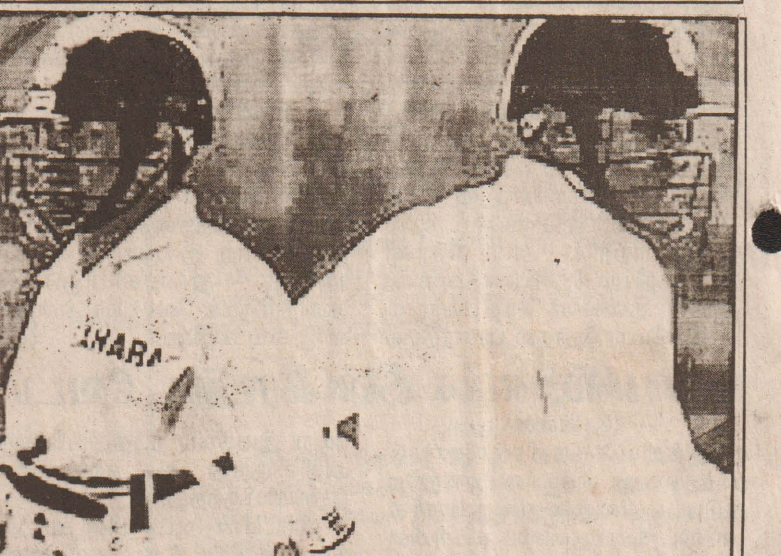
இந்திய அணியின் டெஸ்ட் வெற்றிக்கு காரணமான கிந்தியாவின் சச்சின் டெண்டூல்கரும் வீரேந்தர் ஷேவாக்கும் மைதானத்தல் ஆட்டநேரத்தின் போது காணப்படுகின்றனர்.