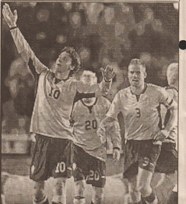
பிரித்தானிய உதைபந்தாட்ட அணியை 1:0 என்ற அடிப்படையில் அண்மையில் வெற்றிகொண்ட சுவீடன் அணியின் வீரர்கள் மகிழ்ச்சி கொண்டு டாடுவதைப் படத்தில் காண்கிறீர்கள்.