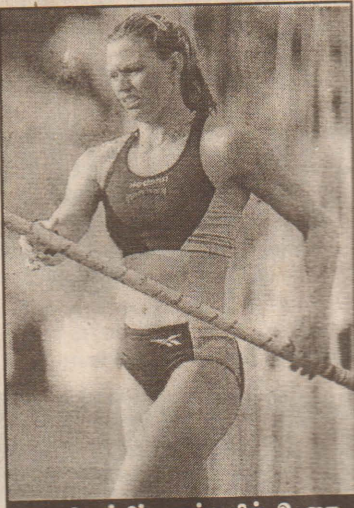
தடி உன்றிப் பாய்தலில் உலக சம்பியன் பட்டத்தை வென்ற அமெரிக்காவின் விராங்கனை எமா ஜோர்சு தனது மெய்வல்லுநர் வாழ்விலிருந்து ஓய்வு பெறுவதாக அறிவித்துள்ளார்.

19வயது - யா/மகாஜனாக் கல்லூரி எதிர், யா/சோமஸ்கந்தாக் கல்லூரி. 17வயது - யா/உடுப்பிட்டி அ.மி. கல்லூரி எதிர், யா/சாவகச்சேரி இந்து. 19வயது - யா/மட்டுவில் சந்திரபுரஸ்கந்தவரோ எதிர், யா/நெடுந்தீவு ம.வி. 15வயது - யா/ஆவரங்கால் மகாஜனா எதிர், யா/நெல்லியடி ம.ம.வி. 17வயது - யா/ஆவரங்கால் நடராஜ இராமலிங்கம் எதிர், யா/நெடுந்தீவு ம.வி. 17வயது - யா/இளவாலை மெய்கண்டான் எதிர், யா/நெடுந்தீவு ம.வி. 15வயது - யா/நயினாதீவு ஸ்ரீகணேசா எதிர், யா/நெல்லியடி ம.ம.வி. போட்டிகளில் கலந்துகொள்ள வேண்டிய அணிகள் போட்டி நிரலைக் கவனமாகப் பரிசீலித்து ஆயத்த நிலையிலிருக்குமாறும் தேவையான உணவு, குடிதண்ணீர் கொண்டு வருமாறும் அறிவுறுத்தப்படுகிறது. (யே)