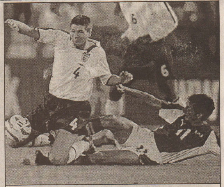
இங்கிலாந்து வீரர் பிரான்ஸ் லம்பேட் எதிரணி வீரர் டேவிட் பெக்ஹாம் அடித்த உதையை கோலாக மாற்றுகிறார்.