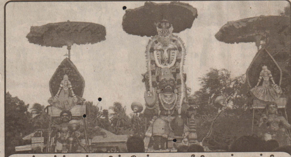
நல்லூர்க் கந்தனின் நேற்றைய வீதியலாக் காட்சி