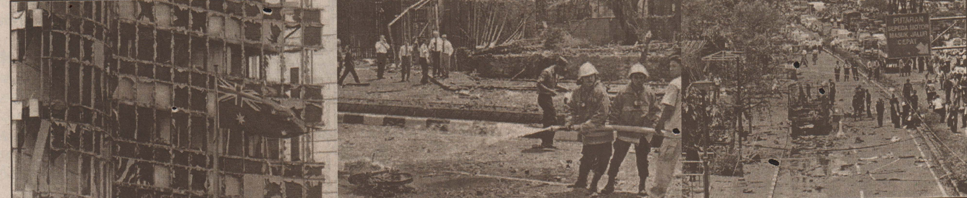
இந்தோனேஷிய தலைநகர் ஜகார்த்தாவில் உள்ள அலுவல்தரைய சூதாக்கத்திற்கு அருகில் கிடம்பெற்ற குண்டு வெடிப்பில் 6பேர் கொல்லப்பட்டனர். நூற்றுக்கும் அதிகமானோர் காயமடைந்தனர். இக்குண்டு வெடிப்பினால் சேதமடைந்துள்ள அலுவல்தரைய சூதாக்கத்தையும், தீயணைப்புப் படையினர் மீட்பும் பணியில் ஈடுபட்டிருப்பதையும் படங்களில் காணலாம். (ப)

படைகள் நடவடிக்கைகளைத் தொடங்கியுள்ளன என்று அமெரிக்க இராணுவ அதிகாரிகள் கூறினர். இத் தாக்குதலால் ஆ.பர் நகரமெங்கும் குண்டு வெடிப்புச் சத்தங்களும், வெடியோசைகளும் கேட்டுவருவதாகவும் அப்பகுதியெங்கும் புகைமண்டலமாகக் காட்சியளிப்பதாகவும் ஈராக்கியத் தகவல்கள் தெரிவிக்கின்றன. இத் தாக்குதல்களில் சுமார் 150ற்கும் மேற்பட்ட அல்-கெய்தாத் தீவிரவாதிகள் கொல்லப்பட்டிருக்கலாமெனவும், தொடர்ந்து அமெரிக்கப் படைகள் போர் விமானங்கள், டாங்கிகள் என்பவற்றின் உதவியுடன் தாக்குதல்களை நடத்திவருவதாகவும் அங்கிருந்து கிடைக்கும் தகவல்கள் தெரிவிக்கின்றன. (ப)