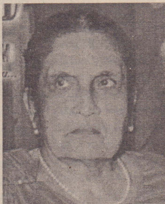
புதிய அரசியலமைப்பு நிறைவேற்றி அமுலுக்கு வரவேண்டுமெனப் பெரிதும் விரும்பியிருந்தார். மக்கள் அனைவரும்

அவர் அங்கு மேலும் குறிப்பிடுகையில் கடும் சுகவீனமாக இருந்த போதும் பாராளுமன்றத்தில் புதிய அரசியலமைப்பு சமர்ப்பிக்கப் பட்டபோது முச்சக்கர வண்டியில் அங்கு வருகை தந்திருந்தார்.