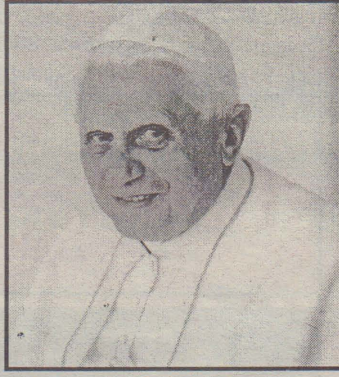
களின் இறுதியில் திருத்தந்தை இக்கருத்தை வெளியிட்டார்.

அப்படியான வாழ்வுக்கு தம்மை மாற்றிக்கொள்வோருக்கு ஒன்றிப்பு கடினமான விடயமல்ல என்றும் அவர் கூறினார். கடந்த மாதம் 18ம் திகதி முதல் 25ம் திகதி வரை அனுசரிக்கப்பட்ட கிறிஸ்தவ ஒன்றிப்பு வார நிகழ்வு