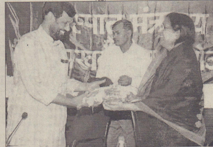
புகழிடில்லியில் நடைபெற்ற விழா ஒன்றில் கலந்து கொண்டு வீரதுகளை வழங்கினார். இரும்பு மற்றும் கிரசாயனத்துறை அமைச்சர் ராம்விவால் பால்வான்.