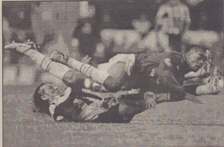
இரண்டாவது சம்பியன் அணிகளுக்கான விளையாட்டுப் போட்டியில் மான்செஸ்டர் அணி 6-2 என்ற கோல் கணக்கில் பெனர்பாஹ் அணியை வெற்றி கொண்டது.