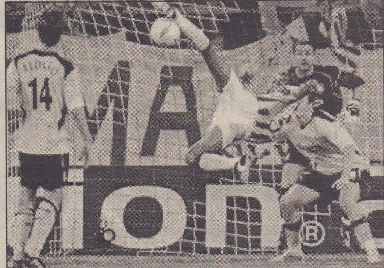
எதென்ஸில் நடைபெற்ற ஒலிம்பிக் போட்டியில் லீவ்புட்ல் அணி எதிர்பாராத விதமாக 1-0 என்ற கோல் கணக்கில் கிரீக் அணியிடம் தோல்வியடைந்தது.

இதனால் 15நிமிட கூடுதல் நேரம் வழங்கப்பட்டது. இதில் சத்திரிதின் அப்துல் கோஸ் அடிக்க, உஸ்பெஸ்கிஸ்தான் 2-1 என்ற கோல் கணக்கில் இந்திய அணியை வென்றது. முன்னதாக முதல் லீக் போட்டியில் இந்திய அணி 1-2 என்ற கணக்கில் சிரியாவிடம் தோல்வி அடைந்தது. இதன் மூலம் இந்திய அணி தொடர்லிருந்து வெளியேறியது. உஸ்பெஸ்கிஸ்தான், சிரியா-அணிகள்-காலியூறுதிக் தகுதி பெற்றன.