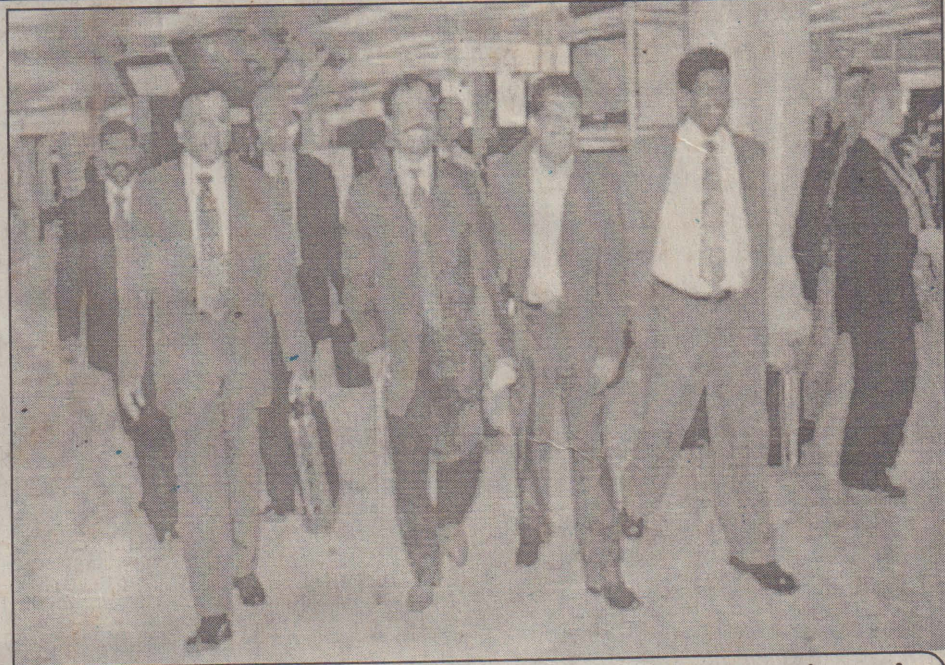
சுவீஸ்லாந்து விமான நிலையத்தில் புலிகளின் பிரமுகர்களுக்கு நேற்று அமோக வரவேற்பு அளிக்கப்பட்டது.

விற்குப் புறப்பட்டுச் செல்கின்றனர். ஐக்கிய நாடுகள் சபையின் மனித உரிமைகள் அமைப்பினரோடு கலந்துரையாடி வடகிழக்கு மனித உரிமை ஆணைக்குழுவிற்கு யாப்பொன்றைத் தயாரிக்கும் நிகழ்ச்சித் திட்டத்தின் அடிப்படையிலேயே சந்திப்புகள் இடம்பெறவுள்ளதாக ஆணைக்குழு (10 ஆம் பக்கம் பார்க்க)